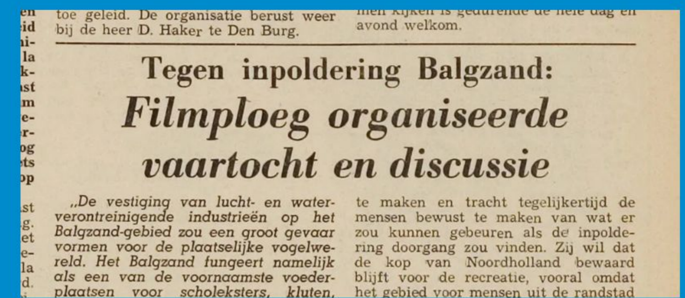
Protest tegen inpoldering, Texelse Courant 26 mei 1970

Uiteindelijk werd het hele Balgzandplan in 1978 na soms verhitte discussies afgeblazen. Het Balgzand bleef wad. Dat betekende wel verhoging van de oude Waddenzeedijken tussen Den Helder en Oever tot Deltahoogte. En Den Helder moest genoegen nemen met een klein strookje nieuw land waarop het bedrijventerrein Oostoever werd gevestigd.