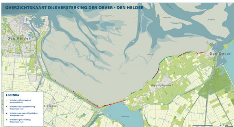
Traject dijkversterking DO-DH

Het college van dijkgraaf en hoogheemraden (D&H) van Hoogheemraadschap Hollands Noorderkwartier heeft ingestemd met de plannen voor de versterking van de dijk tussen Den Oever en Den Helder (Wieringer Zeewering, Amsteldiepdijk, Balgzanddijk). Een mijlpaal voor dit Hoogwaterbeschermingsproject. Het hoogheemraadschap gaat volgens de Omgevingswet samen met de omgeving nu de best passende oplossing per dijkvak in detail verder uitwerken. Zodat ook in de toekomst de inwoners in dit gebied veilig kunnen blijven wonen, werken en recreëren.