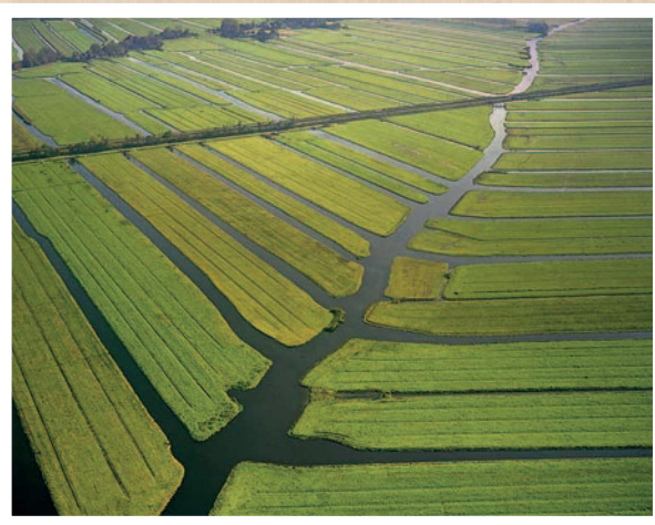
Ontginning: tussen de 10 de en de 12 de eeuw werd het gebied langs de huidige Markermeer geschikt gemaakt voor bewoning en landbouw door sloten te graven, waardoor het veen ontwaterde en mooie lange kavels ontstonden.

gelegd door middel van zogenaamde inlaagdijken.