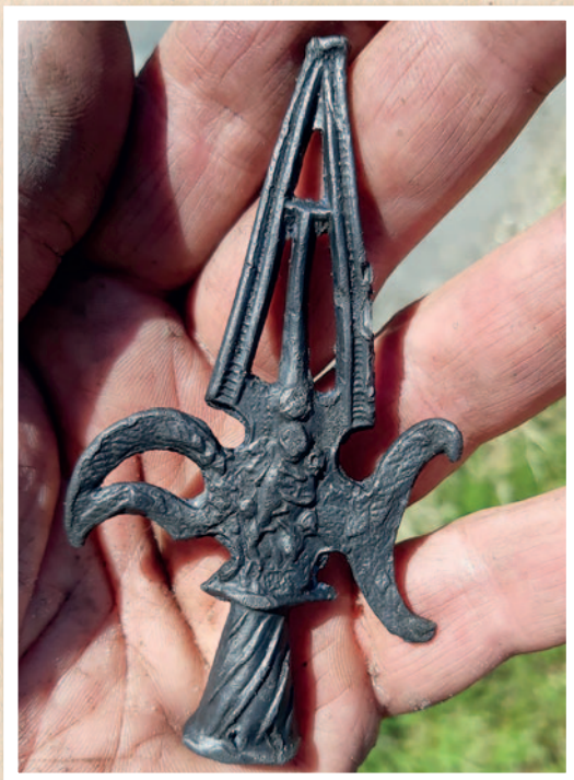
Puntgave miniatuur hellebaard net uit de grond. In het midden is de heilige Charitas met drie kinderen zichtbaar.