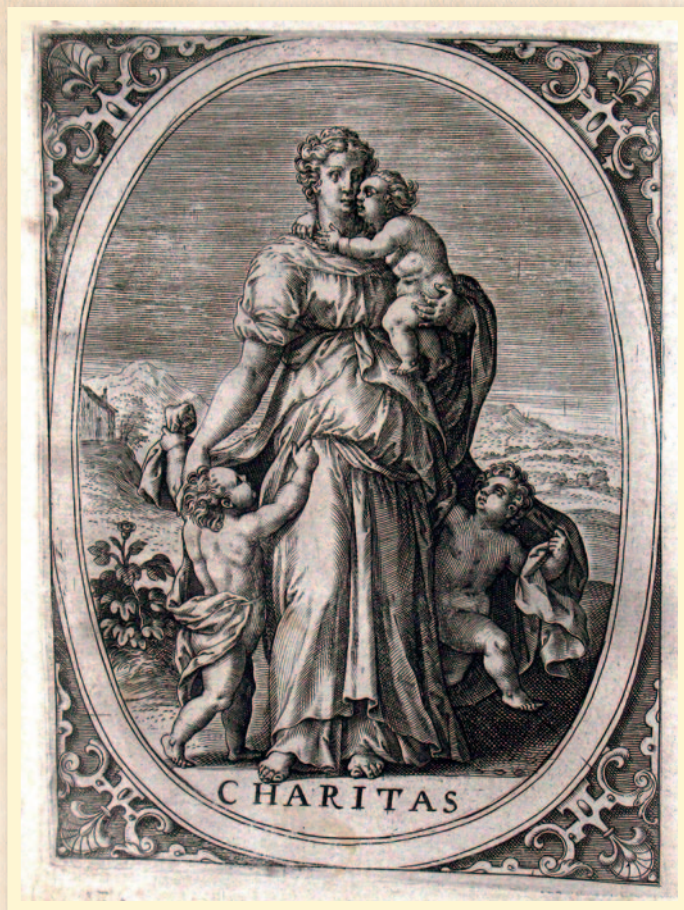
Voorstelling van Charitas, kopergravure door Jan Collaert, circa 1580.

Duidelijk van militaire aard is een draadkogel, bestaande uit twee loden kogels met een diameter van 3,8 cm verbonden met een gekrulde koperdraad. Dit type kogel werd in de 17 de en 18 de eeuw vanuit scheepskanonnen op vijandelijke schepen afgevuurd om schade toe te brengen aan masten en tuigage. Een andere vondst die getuigt van de internationale zeevaart is een kaurischelpje afkomstig uit de Indische of westelijke Stille Oceaan. Dergelijke tropische schelpen werden onder andere door de VOC in Oost-Azië opgekocht en verhandeld.