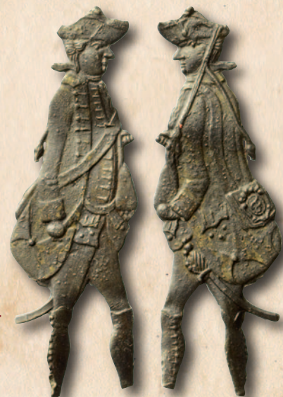
Kinderspeelgoed miniatuur: laat 18 de -eeuws soldaatje.