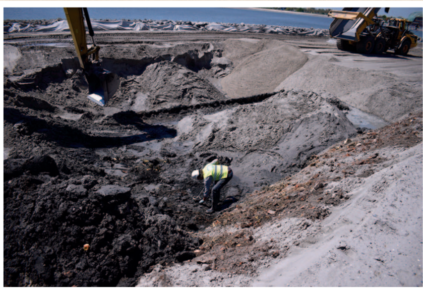
Tussen de werkzaamheden door raapt een medewerker van Archeologie West-Friesland een metalen object op gevonden met zijn metaaldetector.

Deze verschillende losse dijken werden met elkaar verbonden, waardoor West-Friesland vanaf circa 1250 werd beschermd door één lange geschakelde dijk: de Westfriese Omringdijk. Deze dijk is in de eeuwen hierna nog diverse malen doorgebroken, waardoor land afsloeg en klei en zand werd afgezet. De ligging van de Omringdijk is in de loop der eeuwen sterk gewijzigd. Door het verdwijnen van het voorland, het land dat voor de dijk lag, verzwakte de dijk. Daarom moest deze op een groot aantal plaatsen landinwaarts worden terug-