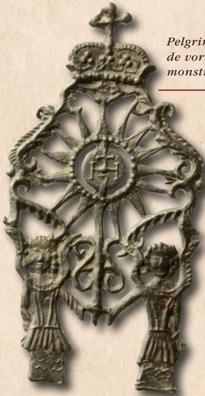
Pelgrimsinsigne in de vorm van een monstrans, 15 de eeuw.