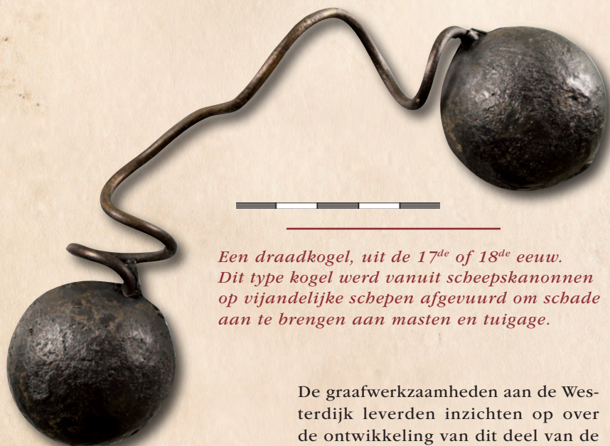
Een draadkogel, uit de 17 de of 18 de eeuw. Dit type kogel werd vanuit scheepskanonnen op vijandelijke schepen afgevuurd om schade aan te brengen aan masten en tuigage.

De graafwerkzaamheden aan de Westerdijk leverden inzichten op over de ontwikkeling van dit deel van de stad vanaf de Late Middeleeuwen. De vele spectaculaire vondsten geven een mooie inkijk op het leven van de Horinezen van de afgelopen 600 jaar.