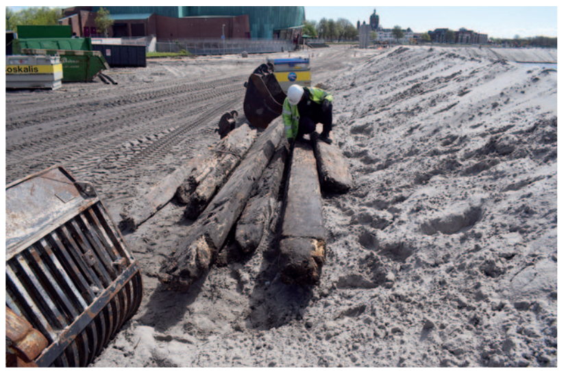
De getrokken palen worden verder schoongemaakt, gemeten en onderzocht op de aanwezigheid van merktekens van de houthandelaren.

De oudste vondsten uit de grond langs de oude kade bestaan uit draaginsignes van tin uit de 15 de eeuw. Naast een sierlijke opengewerkte broche met ingelegd glas aan de binnenzijde (zie cover) is bijvoorbeeld een prachtig bewaard gebleven katholiek pelgrimsinsigne op te merken. De monstrans wordt gedragen door twee engelen en toont een hostie met het IHS-monogram binnen een stralenkrans. IHS staat voor Jesus hominum salvator (Jezus de redder der mensen).