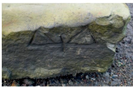
Een merkteken op een natuursteen afkomstig uit de Westervoort, rond 1500.

Een groot deel van de opgebaggerde stenen bevatte gebeitelde merk-