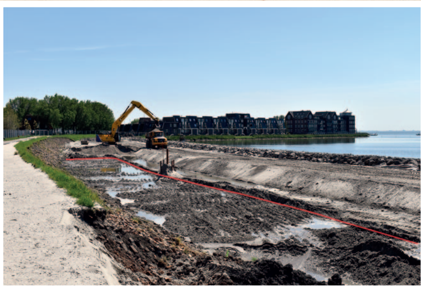
Tijdens het weggraven van de zandbaan wordt de rand van de Westervoort afgeknabbeld en komt op een dieper niveau de houten kade (rode lijn) zichtbaar. Op de achtergrond het Visserseland.

De stenen gevonden langs de Westervoort worden bekeken, beschreven en gefotografeerd.