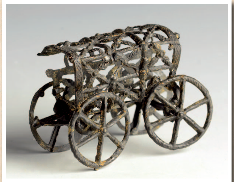
Kinderspeelgoed miniatuur: laat 15 de of 16 de -eeuwse huifkar.

Ook werden opvallend veel stukken kinderspeelgoed uit verschillende eeuwen aangetroffen. Enkele topstukken zijn een 15 de of 16 de -eeuwse huifkar en een tinnen soldaatje uit de 18 de eeuw. Fraai is ook de vondst van een laat 16 de of vroeg 17 de -eeuwse miniatuur hellebaard met daarop een voorstelling van Charitas afgebeeld als een vrouw omgeven met kinderen. Charitas oftewel de liefdadigheid was een van de christelijke deugden die zowel in katholieke als protestantse kringen