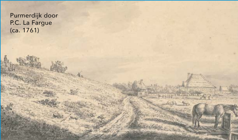
Purmerdijk door P.C. La Fargue (ca. 1761)

Op het wapen van Waterschap de Purmer staat het 'Purmer zeewijf'. Het verhaal gaat dat bij een hevige storm in 1403 het zeewijf met het water van de Zuiderzee het Purmermeer in stroomde. Edamse melkmeisjes vingen haar en leerden haar spinnen. Ze trouwde met een visser en kreeg een schare kinderen. Hier ziet u haar met de melkmeisjes afgebeeld.