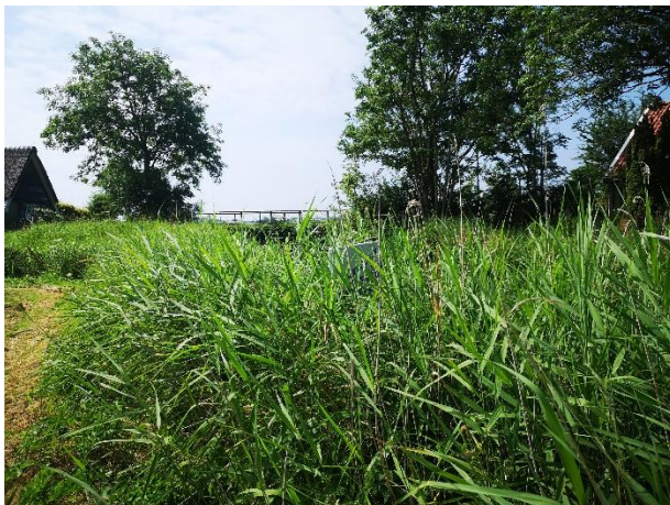
2. Wandelstartpunt Tolke