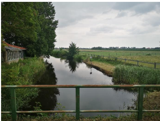
7. Wandelstartpunt Tolke