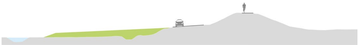
Binnenwaarts versterken ter hoogte van landerijen/percelen