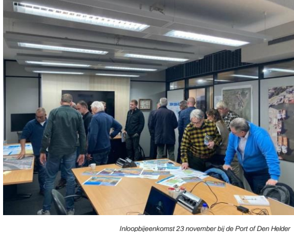
Inloophbijeenkomst 23 november bij de Port of Den Helder

Op donderdag 23 november heeft het projectteam van de Havendijk de eerste inloophbijeenkomst van de verkenningsfase verzorgd. Met dank aan de Port of Den Helder kon de bijeenkomst gehouden worden op het kantoor van de Port midden in het projectgebied. Het projectteam stond daar samen met medewerkers van de Port of Den Helder klaar om een toelichting te geven en vragen te beantwoorden. We kijken terug op een waardevolle inloophbijeenkomst. Met belangstelling van leden van watersportverenigingen tot ondernemers en bewoners. Het is altijd interessant te horen wat er zo al in de omgeving leeft, wat de waarden van het gebied zijn en waar we als projectteam rekening mee moeten houden.