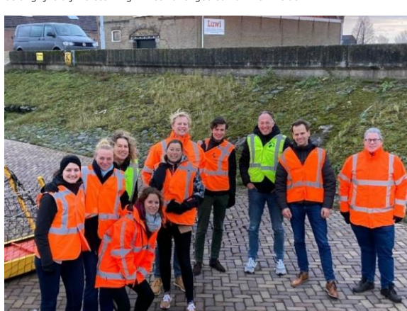
Het projectteam van Den Helder aangevuld met de combinatie TAUW/IV-Infra

De verkenningsfase van dit project wordt niet alleen door het hoogheemraadschap uitgevoerd. Om deze fase tot een succes te maken worden we ondersteund door de combinatie TAUW en IV-Infra. Voorafgaand hebben we een Europese aanbestedingsprocedure doorlopen en zij zijn als combinatie het beste naar voren gekomen als het gaat om de prijs-kwaliteitverhouding. Afgelopen december heeft de Project Start Up (PSU) plaatsgevonden en zijn we officieel van start. Wij kijken ernaar uit om de komende periode samen het ontwerp te maken voor deze belangrijke dijkversterking in het havengebied van Den Helder.