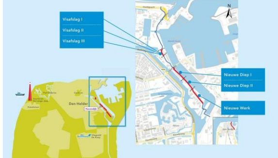
Overzichtkaart dijkversterking Havendijk

Voor u ligt de eerste nieuwsbrief van de dijkversterking van de Havendijk. De Havendijk is een 2,6 kilometer lange dijk langs Het Nieuwe Diep die de status heeft van primaire waterkering. Deze waterkering beschermt het gebied achter de dijk tegen de zee. De dijk is in 2021 beoordeeld en uit deze beoordeling is gebleken dat 959 meter van de Havendijk niet meer voldoet aan de norm voor waterveiligheid. Dit deel, verspreid over de Havendijk, tussen de Paleiskade en het Nieuwe Werk moet dus versterkt worden. Hoogheemraadschap Hollands Noorderkwartier (HHNK) is daarom gestart met de verkenningsfase om tot de best mogelijke versterkingsoplossing te komen. In deze eerste nieuwsbrief geven wij een terugblik op afgelopen periode en kijken vooruit naar wat er in het eerste kwartaal van 2024 gaat gebeuren.