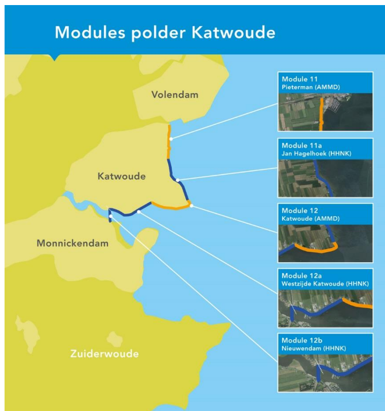
Afbeelding 1: Modules Polder Katwoude