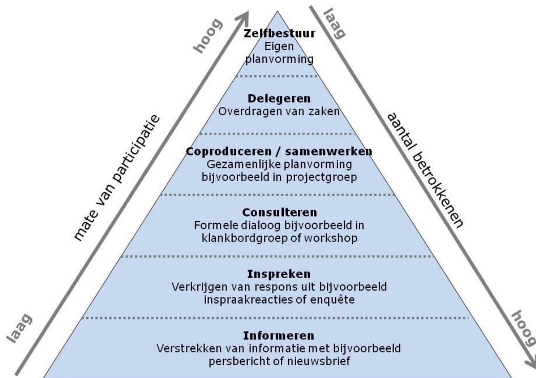
Afbeelding 4: Participatieladder en participatievorm