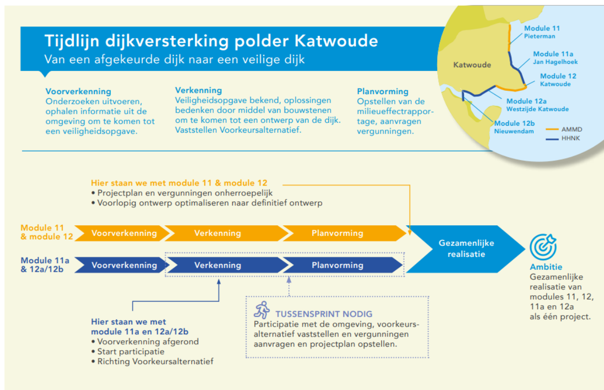
Afbeelding 3: Tijdelijk Dijkversterking Katwoude