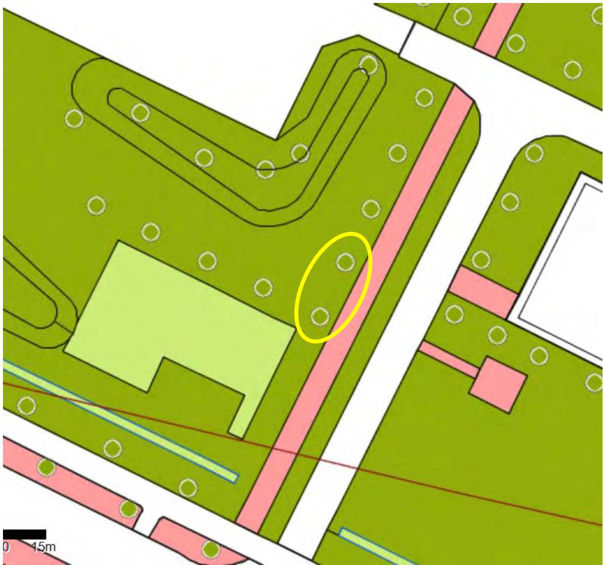
Locatie alsnog gekapte twee populieren surfstrand Zuiderzee