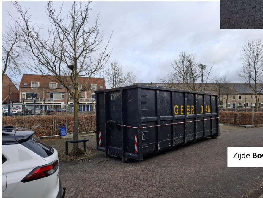
Zijde Bovenmaatweg - parkeerplekken