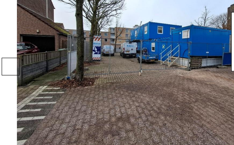
Oostkade - Bouwketen / tegenover gelegen parkeervakken - Onoverzichtelijk fietspad