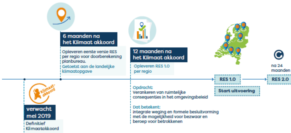
Figuur 2: Planning Klimaatakkoord en RES (bron: Landelijke Handreiking RES voor regio's)

Om snel te kunnen starten na ondertekening van het Klimaatakkoord en daardoor de 6 maanden goed te kunnen benutten, kiest regio 4 Noord-Holland Zuid er voor om de besluitvorming van de startnotitie los te koppelen van de ondertekening van het Klimaatakkoord en voor te leggen aan de gemeenteraden, Provinciale Staten PNH en het Algemeen Bestuur van HHNK, Rijnland en AGV (Waternet).