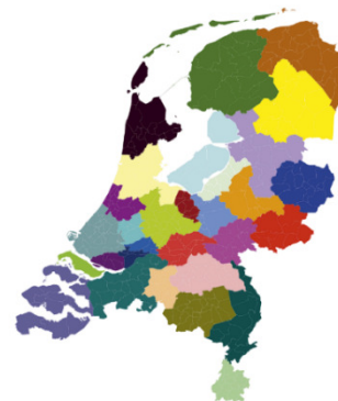
Figuur 1: Indeling energie-regio's

Voor het uitwerken en realiseren van de nationale doelen en afspraken is regionaal en lokaal maatwerk nodig. Het vraagt om nieuwe manieren van intensieve samenwerking tussen overheden, netwerkbeheerders, inwoners, bedrijven en maatschappelijke partners. Daarom hebben de overheden in het Interbestuurlijke Programma (IBP februari 2018) afgesproken een meerjarige programmatische nationale aanpak met land dekkende Regionale Energie Strategieën (30 regio's) uit te werken (landelijk programma RES 1 ). In het IBP is ook afgesproken dat de besluitvorming over de uitvoering van deze strategieën plaatsvindt via het omgevingsbeleid van gemeenten, provincies en Rijk en via het beleid van de Waterschappen (o.a. waterbeleidsplannen). De regio Noord - Holland Zuid (NHZ) is één van deze 30 RES-regio's van Nederland.