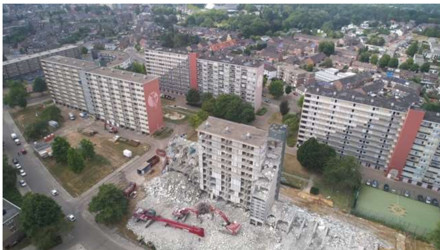
Overzichtsfoto van de sloop van flat 1

In juli zijn we gestart met de sloop van de twee flats aan de Hertogenlaan. Als alles blijft gaan zoals gepland, starten we met de sloop van de tweede flat in oktober en zijn we voor het einde van het jaar klaar met deze werkzaamheden.