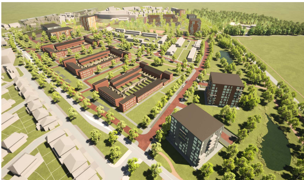
Impressie nieuwe situatie Rolduckerveld (Mgr. Van Gilsstraat – Ailbertuslaan)