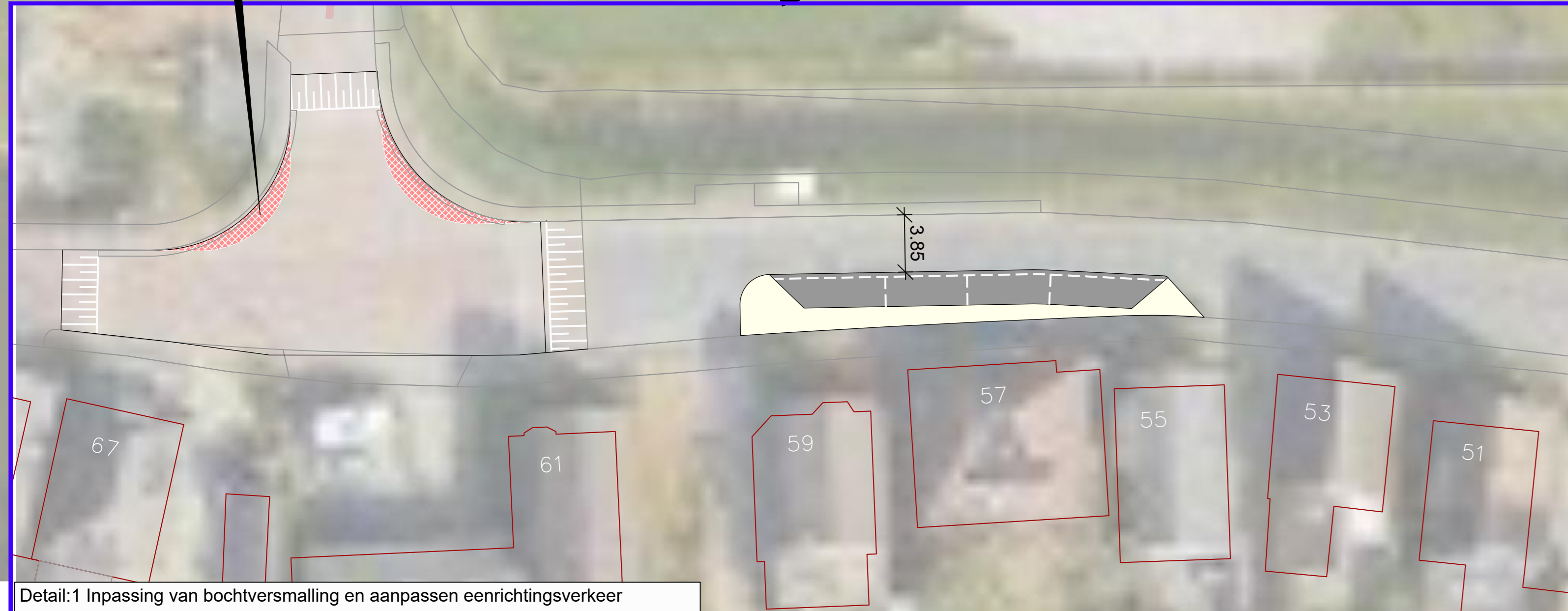
Detail:1 Inpassing van bochtversmalling en aanpassen eenrichtingsverkeer