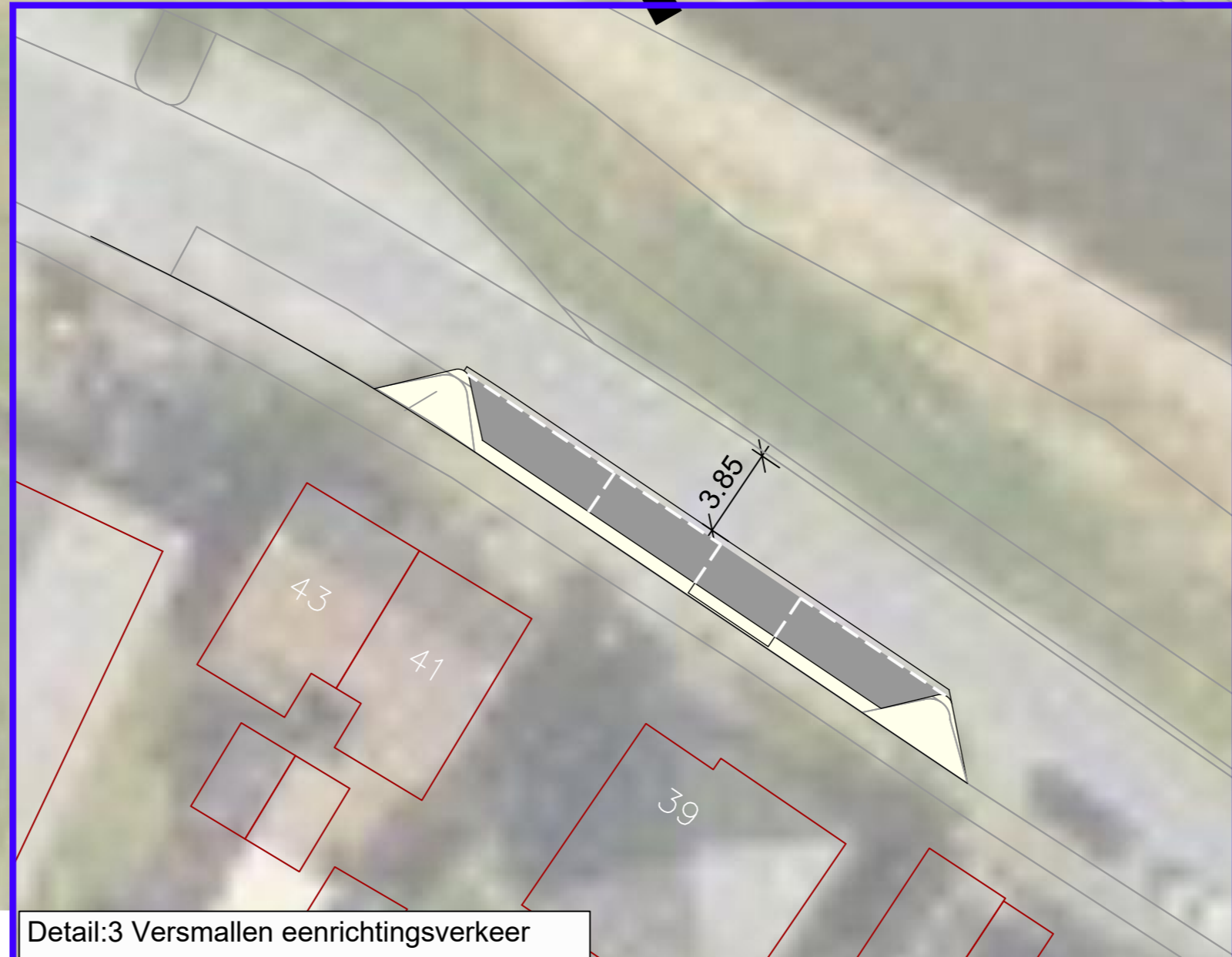
Detail:3 Versmallen eenrichtingsverkeer