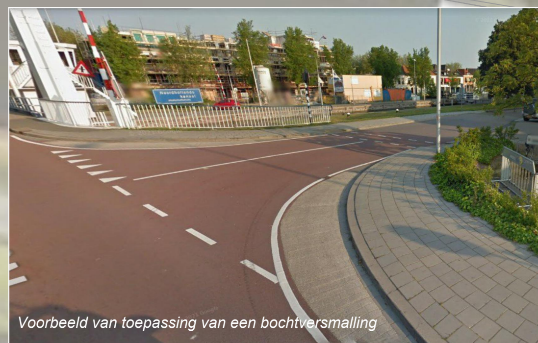
Voorbeeld van toepassing van een bochtversmalling