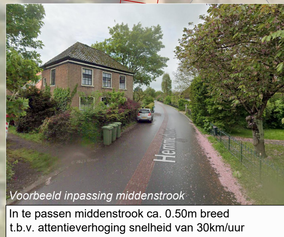
Voorbeeld inpassing middenstrook In te passen middenstrook ca. 0.50m breed t.b.v. attentieverhoging snelheid van 30km/uur