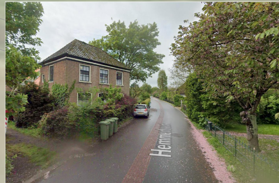
Voorbeeld inpassing middenstrook In te passen middenstrook ca. 0.50m breed t.b.v. attentieverhoging snelheid van 30km/uur