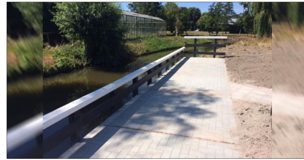
INSPIRATIEPLAATJE VISPLAATS TOEGANKELIJK