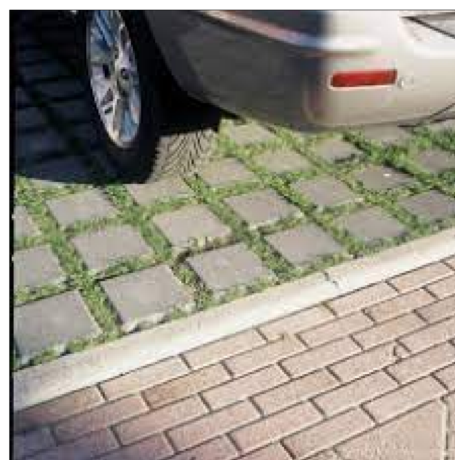
INSPIRATIEPLAATJE GROEN PARKEREN