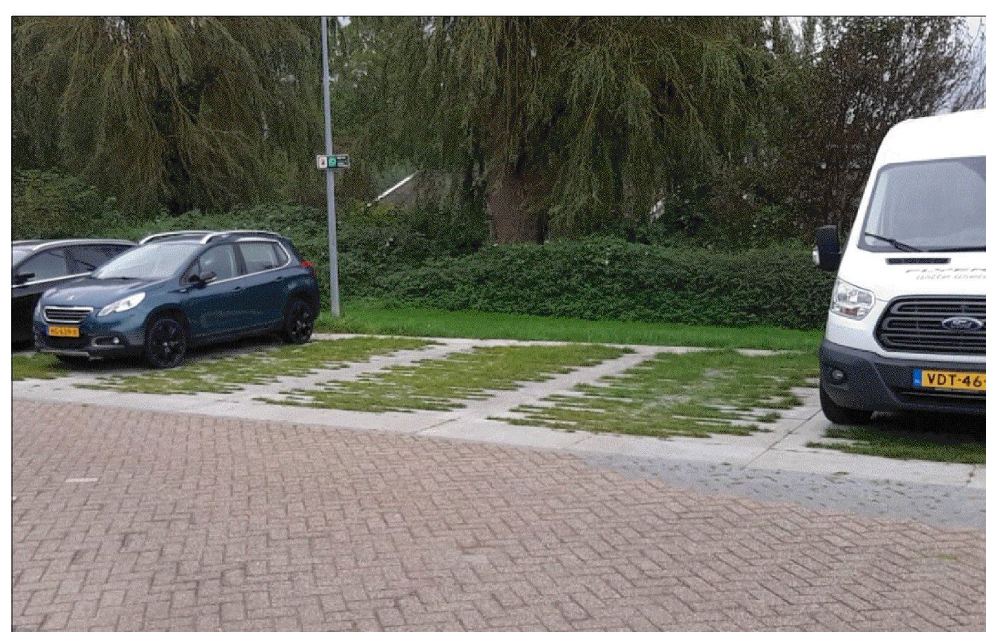
INSPIRATIEPLAATJE GROEN PARKEREN