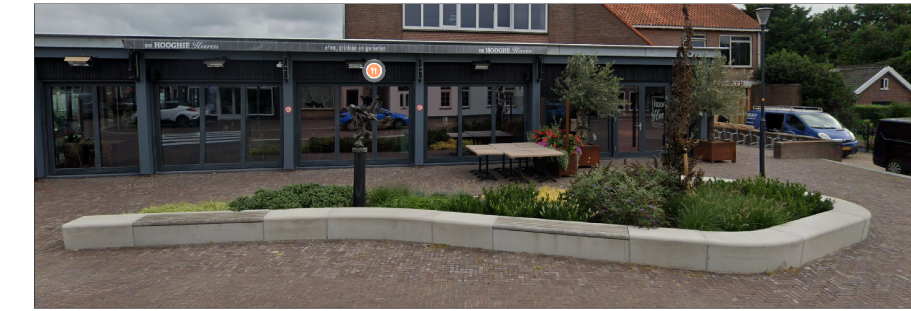
INSPIRATIEPLAATJE ZITRANS KLOET 28-42 en KLOET 67-93