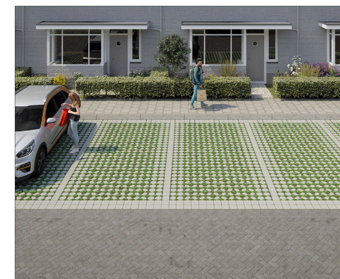
INSPIRATIEPLAATJE GROEN PARKEREN