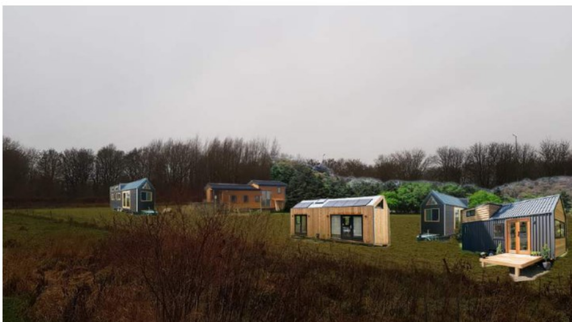
Photoshop visualisatie van huisjes op terrein- zijaanzicht