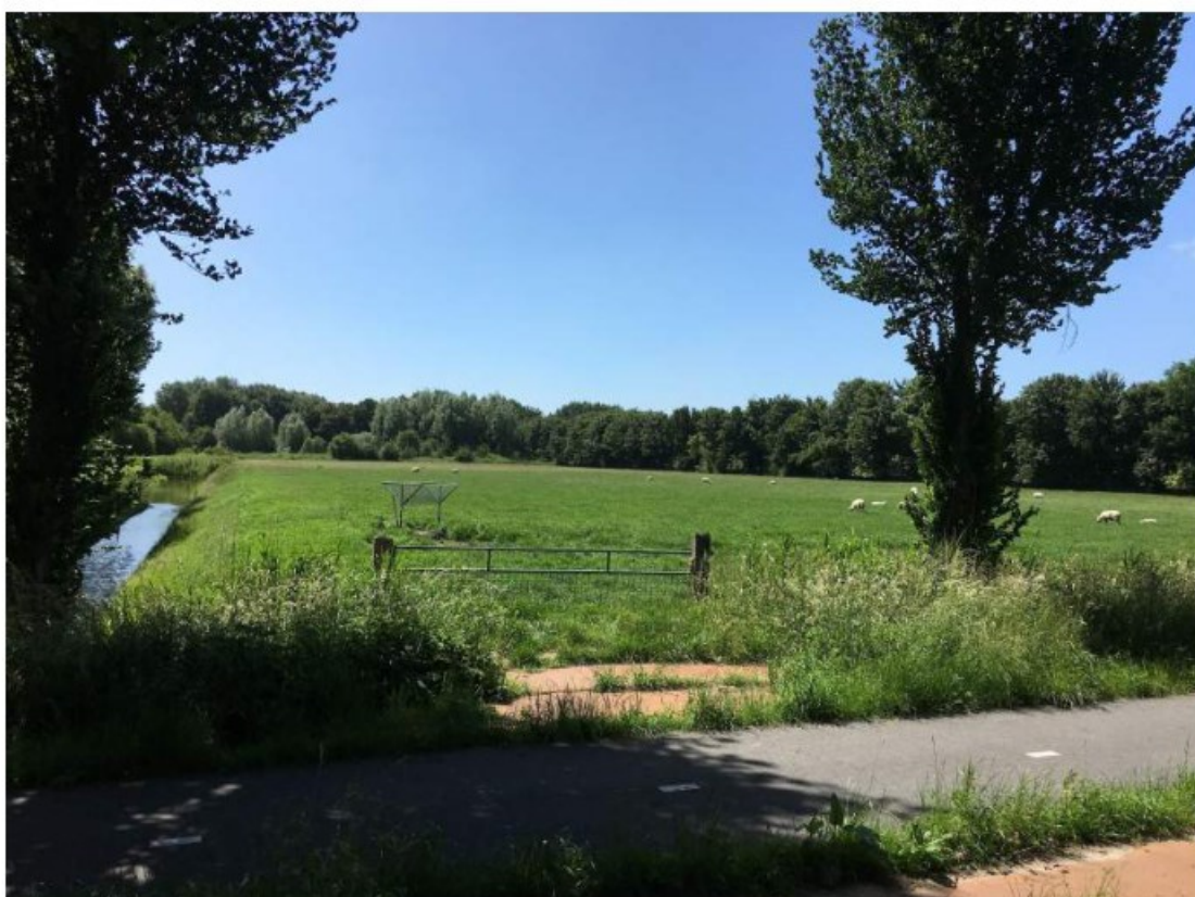
Toegangsweg aan de linkerkant van het terrein