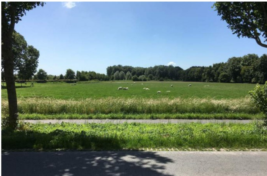
Vooraanzicht locatie vanaf de Julianastraat