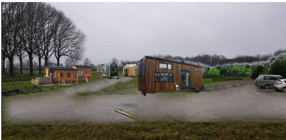
Photoshop visualisatie van huisjes op terrein-vooraanzicht