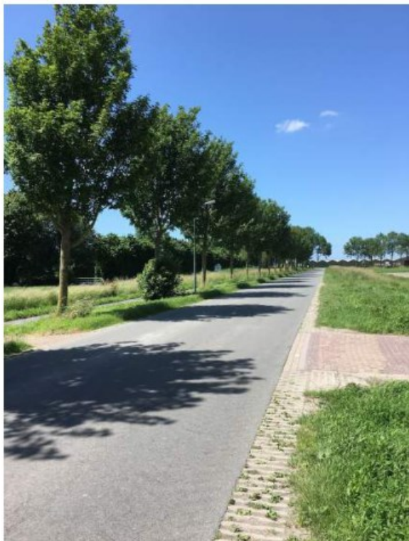
Rechterkant Julianastraat richting de Leet