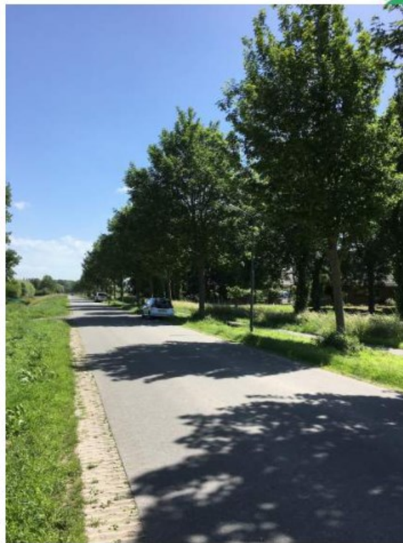
Linkerkant Julianastraat richting Avenhorn