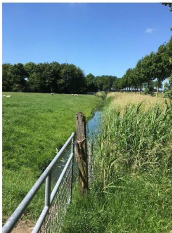
Aangrenzende sloot voorzijde terrein