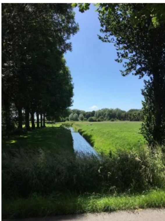
Aangrenzende sloot linkerzijde terrein