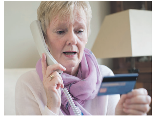
Toename oplichting aan de deur p. 2