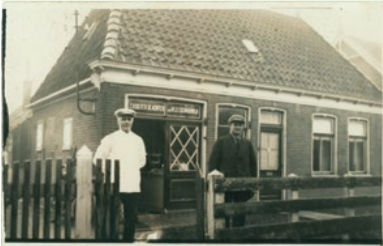
Bobeldijk, omstreeks 1920