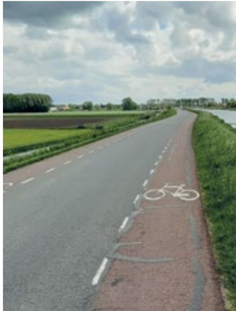
Stilstaan en parkeren op een fietsstrook is verboden voor voertuigen.

Fietsuggestiestroken hebben geen juridische status. Al het verkeer mag hier gebruik