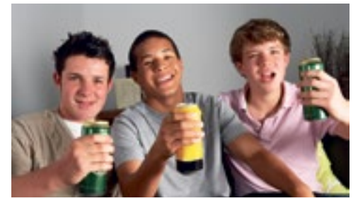
Meer alcohol- en drugsvergiftigingen onder jongeren p. 2