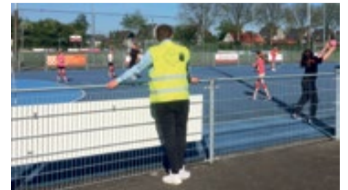
Veiligheidshesjes voor sportclubs p. 2