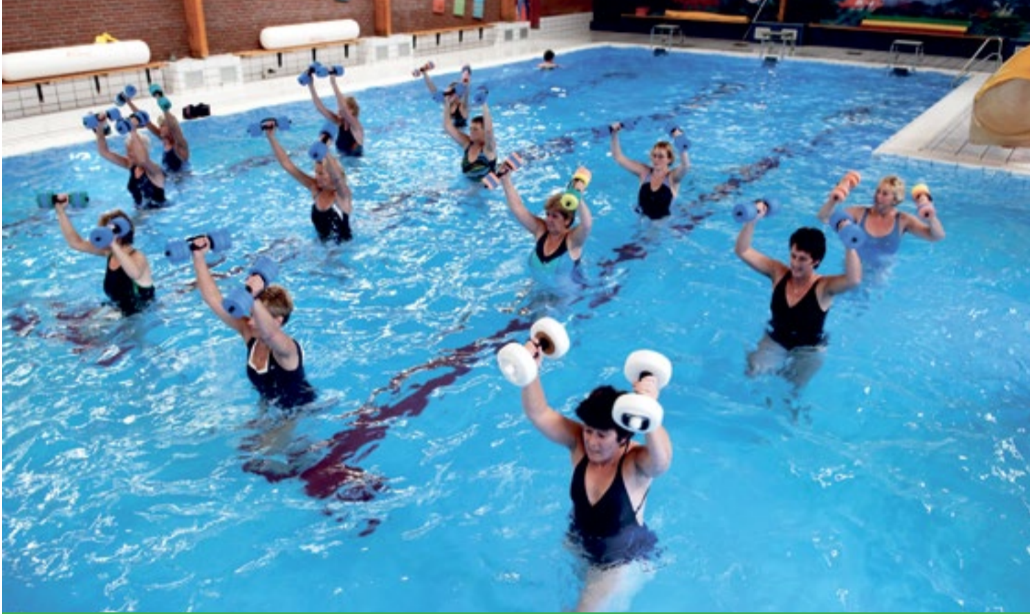
De zwembaden zijn geopend voor onder meer zwemlessen, aquasport en trimzwemmen.

Na de jeugd krijgen ook volwassenen meer ruimte om te sporten. Sinds 18 mei zijn de zwembaden geopend voor onder meer zwemlessen, aquasport en trimzwemmen. Ook andere Koggenlandse sportclubs zijn van start gegaan met het aanbieden van aangepaste sportieve activiteiten.