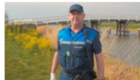
In Koggenland geen geweld tegen boa's p. 2