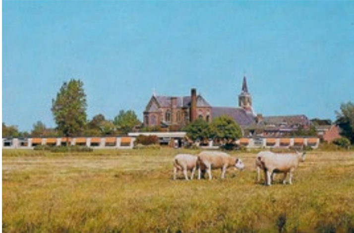
Spierdijk, omstreeks 1985