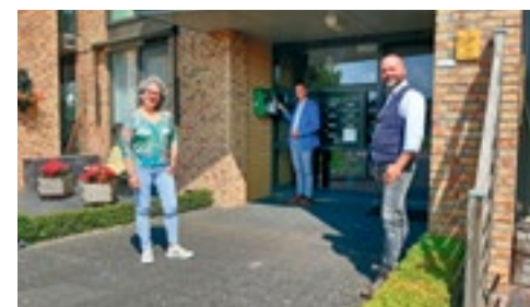
Rotary Koggenland schenkt AED's p. 2

Meer informatie en voorwaarden vindt u op koggenland.nl/starterslening .