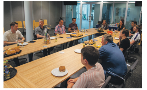
Aan tafel bij de burgemeester – excursie voor Oekraïense mannen p. 2