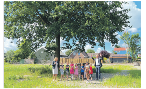
Insectenhôtels in bloemenpracht Avenhorn p. 3

hebben de Westfrieze gemeenten de afspraken aangepast aan de nieuwe situatie van krapte op de bedrijventerreinenmarkt. De nieuwe afspraken zijn tot stand gekomen in nauwe samenwerking met de provincie Noord-Holland en het Ontwikkelingsbedrijf Noord-Holland Noord.