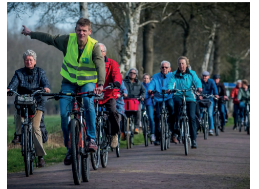
Fietslessen voor senioren p. 2

De Koffiesoos vindt eens in de twee weken plaats, op donderdagochtend van 10.00 tot 11.30 uur, in De Brink in Obdam. De eerstvolgende edities zijn op 11 en 25 augustus. Koffie en thee zijn gratis. De koffiesoos is namelijk ook bedoeld als plek voor mensen die wat minder te besteden hebben. Voor mensen die het kunnen missen staat er een pot waarin de bezoekers een vrijwillige bijdrage kunnen doen.