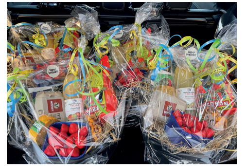
Bedankje voor gastgezinnen Oekraïense vluchtelingen p. 2