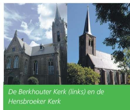
De Berkhouster Kerk (links) en de Hensbroeker Kerk

Op zondag 11 september zijn de Berkhouster Kerk en de Hensbroeker Kerk open voor publiek, in het kader van de Open Monumentendag. Geïnteresseerden kunnen een kijkje nemen in deze historische bouwwerken en luisteren naar de verhalen achter de monumenten.