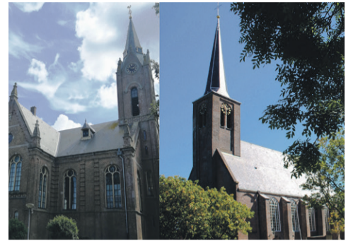
Open Monumentendag p. 2

Gemeente Koggenland werkt bij de aanpak van zwerfafval samen met Schoner Holland. Voor vragen kun je dan ook mailen naar info@schonerholland.nl