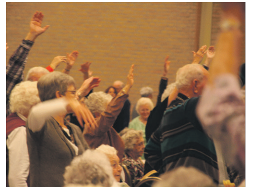
In balans val- en brandpreventie p. 2