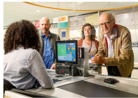
Maak het oplechters niet te makkelijk p. 2