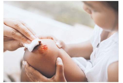
EHBO-cursus voor sportverenigingen