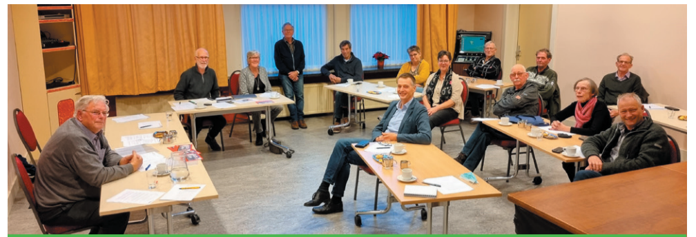
De vrijwillige chauffeurs van Stichting Help een Handje. Wethouder Win Bijman (in het midden) is een van de vrijwilligers.

“Niet al onze inwoners beschikken over eigen vervoer of de mogelijkheid gebruik te maken van het openbaar vervoer,” licht wethouder Bijman toe. “In Obdam werden mensen al geholpen door de vrijwillige chauffeurs van Stichting Help een Handje. Dat werkt al heel lang heel goed. Daarom heb ik de stichting gevraagd ook in de andere dorpen te helpen. Met dit initiatief willen we ook inspelen op het plan van een aantal huisartsenpraktijken om samen te werken onder één dak. Hierdoor zal de behoefte aan vervoer toenemen. De inzet van vrijwilligers biedt een goede oplossing. Daarom ben ik ontzettend blij met de vrijwilligers die zich hebben aangemeld om te helpen.”