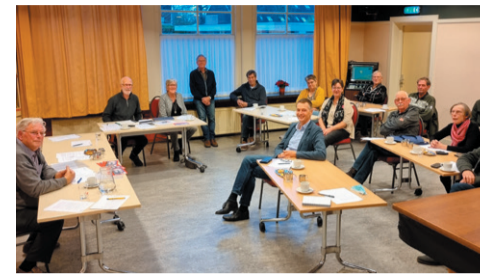
Vrijwillige chauffeurs helpen met vervoer