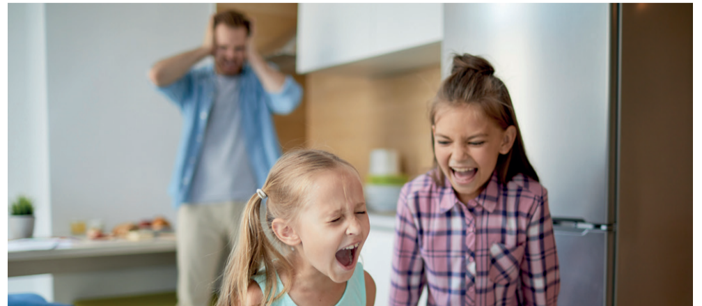
"Veel mensen denken bij jeugdzorg aan ernstige problemen, maar ook kortdurende opvoedondersteuning valt onder de jeugdzorg."