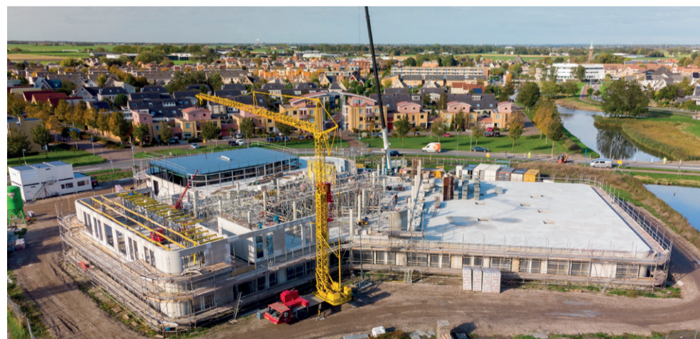
Het gebouw van Kindcentrum Avenhorn begint steeds meer zijn definitieve vorm te krijgen. Naar verwachting is het gebouw eind december wind- en waterdicht. Als alles volgens planning verloopt wordt de bouw volgend jaar voor de zomer afgerond. Na de zomer kunnen de scholen en kinderopvang gebruik maken van het splinternieuwe Kindcentrum.

aan te leggen en bij verdachte zaken of personen contact op te nemen met de wijkagent; dieven doen vaak een voorverkenning. Verder adviseert het CCV om Selecta DNA op de apparaten aan te brengen. Dit is een systeem waarbij dure spullen worden voorzien van een nummer dat met het met blote oog niet te zien is. Met speciale lampen licht dit wel op. Zo kan de politie zien wie de eigenaar is van de gestolen apparatuur en aantonen dát deze is gestolen.