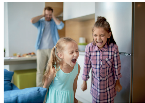
Fors tekort jeugdzorg p. 2