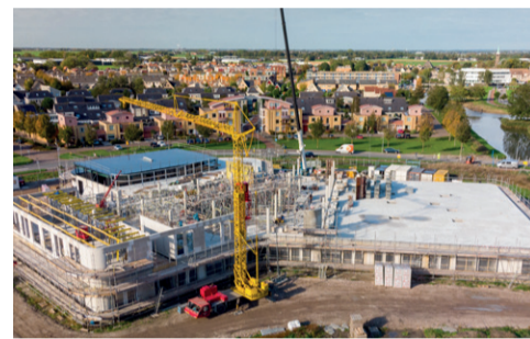
Bouw Kindcentrum volgend jaar zomer afgerond p. 2