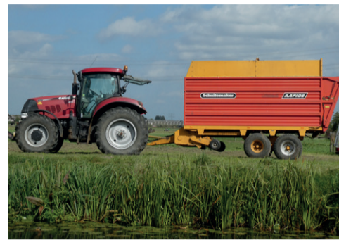
Toename diefstallen uit landbouwvoertuigen p. 2