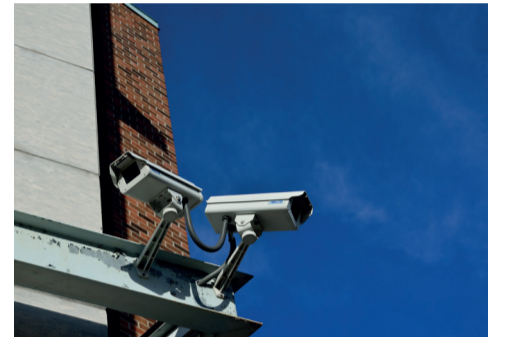
Politie brengt camera's in beeld