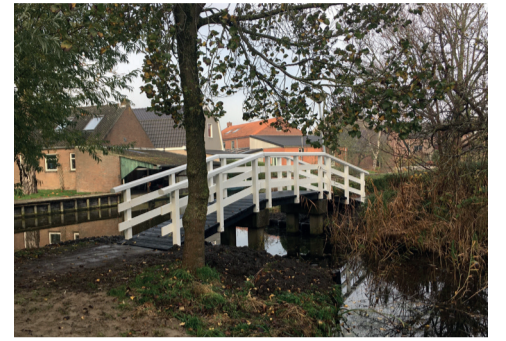
Gemeente vervangt meerdere bruggen

Mantelzorgers die bij de webinar aanwezig willen zijn kunnen zich aanmelden via de website www.ikzorg.nu .