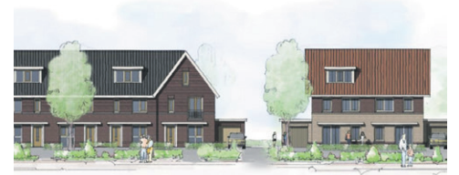
Ontwikkeling koopwoningen Tuindersweijde-Zuid Obdam p. 2

bijeenkomst een groot succes. Vierentwintig inwoners hebben aangegeven dat ze geïnteresseerd zijn in deelname aan de lokale gemeenschap van mijnbuurtje.nl. In ieder geval zeven en mogelijk negen mensen gaven aan 'buurtverbinder' te willen worden. De