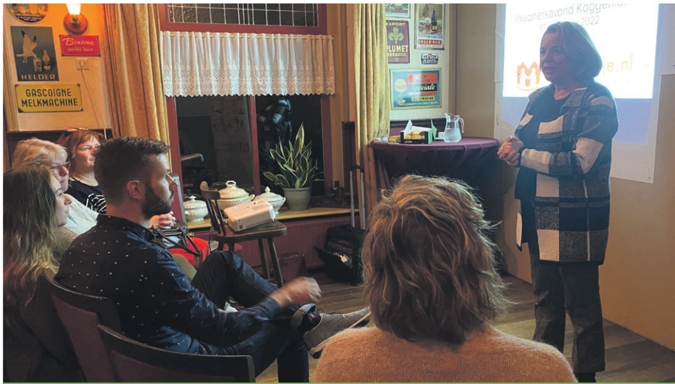
Burgemeester Monique Bosen sprak de aanwezigen toe in Het Wapen van Wogmeer, tijdens de eerste informatieavond over mijn buurtje.nl.

'Zo ontstaat een netwerk waaraan iedereen kan deelnemen en worden de buurten en dorpen nóg fijnere plekken om te wonen,' aldus burgemeester Monique Bosen, die de bezoekers van de bijeenkomst in Het Wapen van Wogmeer