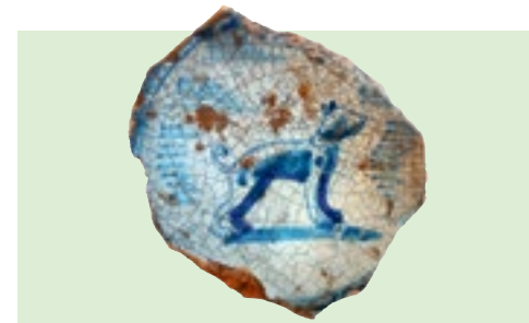
Grondwerkers vinden eeuwenoud bord p.3