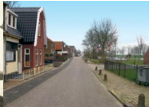
Jaagweg, Avenhorn 2014