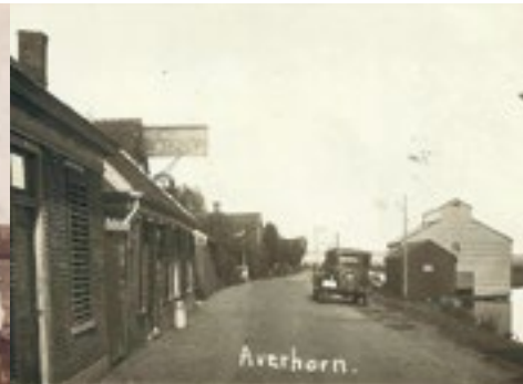
Jaagweg, Avenhorn omstreeks 1930