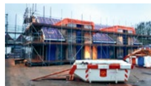
Energiezuinige hofwoningen Ursem p.7