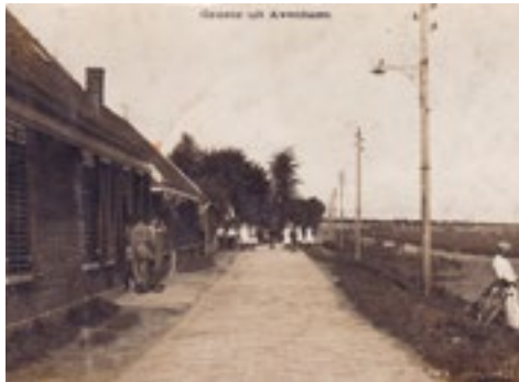
Jaagweg, Avenhorn omstreeks 1910