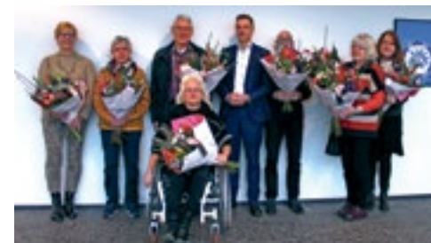
Bedankje voor vrijwilligers p.3