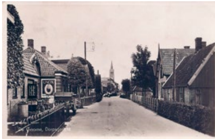
Dorpsstraat, De Goorn, ca. 1950