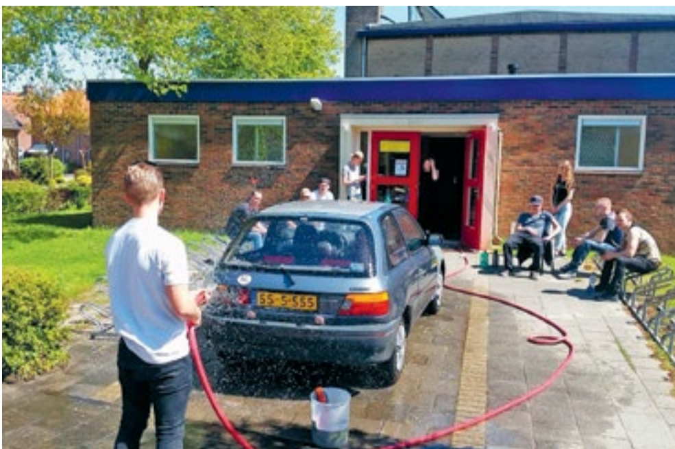
In meerdere teams organiseren jongeren acties waarmee ze geld inzamelen voor een goed doel

Geef van alle teamleden naam, adres, woonplaats, telefoonnummer, emailadres en geboortedatum door. Aan deelname zijn geen kosten verbonden.