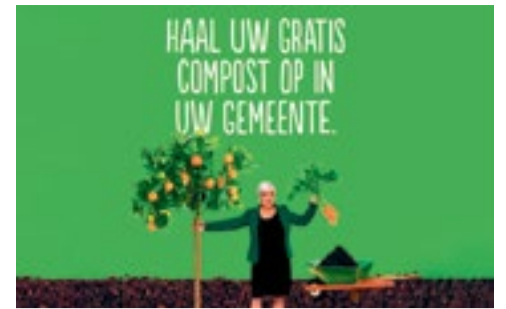
Gratis compost p.3