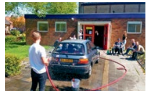
Goede Doelen Uitdaging p.7