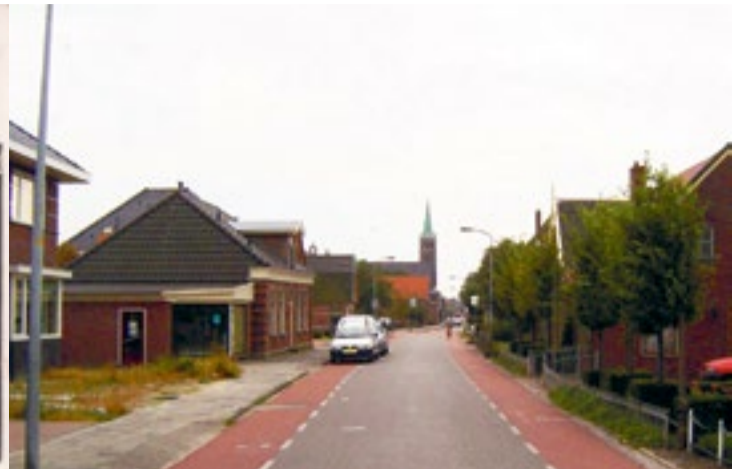
Dorpsstraat, De Goorn, 2008