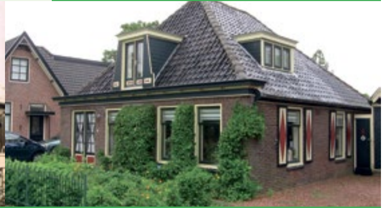
Bobeldijk 95, Berkhout, 2016