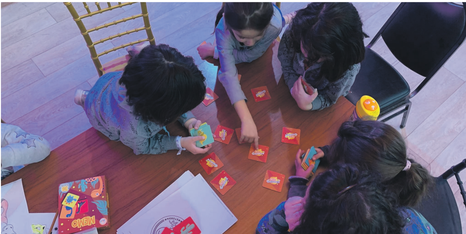
< Kinderen spelen memory in de crisisnoodopvang in Avenhorn.

Er wordt door inwoners regelmatig geïnformeerd of er nog behoefte is aan spullen, dat aanbod wordt erg gewaardeerd. In veel is voorzien, maar herenkleding in de maten S, M of L en jongens-/herenschoenen tot en met maat 44 zijn nodig. Ook direct bruikbare fietsen, zowel voor volwassenen als voor kinderen, zijn zeer welkom. Inwoners die dit beschikbaar hebben, kunnen het bij de portiersloge aan het begin van het terrein afgeven. Om de dagen zonder invulling te doorbreken, biedt Veiligheidsregio Noord-Holland Noord de bewoners dagbesteding aan. Hulp van vrijwilligers is hiervoor onmisbaar, met name 's middags tussen 14.00 en 17.00 uur. Denk bijvoorbeeld aan samen sporten, spelletjes, taalles of creatief bezig zijn. Maar ook andere initiatieven zijn welkom. Inwoners die willen helpen kunnen zich aanmelden via het online aanmeldformulier op www.vrijwilligerspunt.com . ■