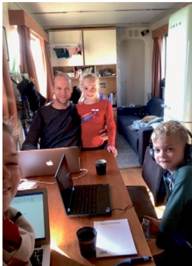
De familie Oudejans uit Hensbroek

Sinds de scholen op 16 maart verplicht hun deuren sloten, wordt in heel Nederland thuisonderwijs gegeven. Voor de ouders, die hun onderwijstaken veelal combineren met een baan, is dat geen makkelijke opgave. Toch lijkt het in de meeste gezinnen goed te gaan. Waar het minder goed gaat, biedt de gemeente hulp.