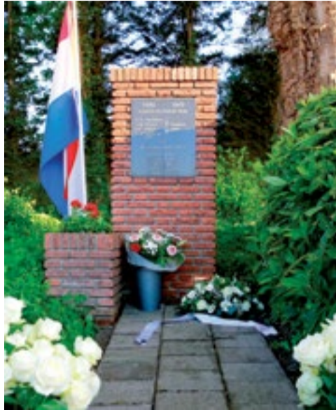
Dodenherdenking 2019 in Berkhout

Vijf Koggenlanders ontvangen op vrijdag 24 april een Koninklijke onderscheiding. Vanwege de maatregelen rondom het coronavirus is een fysieke uitreiking van de lintjes niet mogelijk. Burgemeester Franx neemt op 24 april via een videogesprek contact op met de gedecoreerde Koggenlanders om hen te vertellen dat het Zijne Majesteit de Koning heeft behaagd om