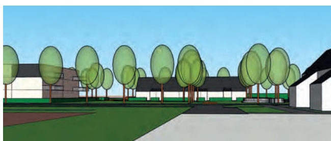
zicht centrale groene plek vanaf Het Veer