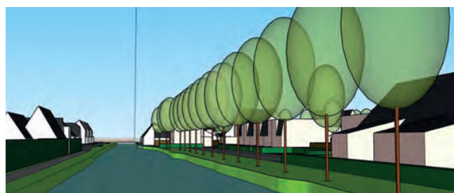
straatbeeld van de fietsbrug over Veersloot