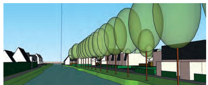
straatbeeld van de fietsbrug over Veersloot