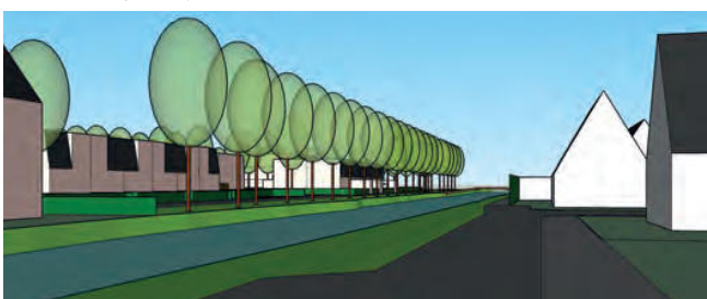
straatbeeld vanaf de Veilingweg