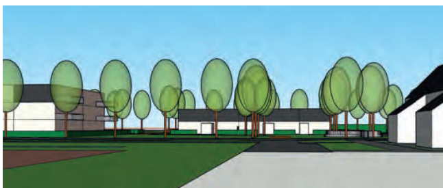
zicht centrale groene plek vanaf Het Veer