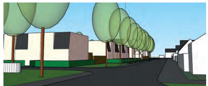
straatbeeld Het Veer vanuit het noorden