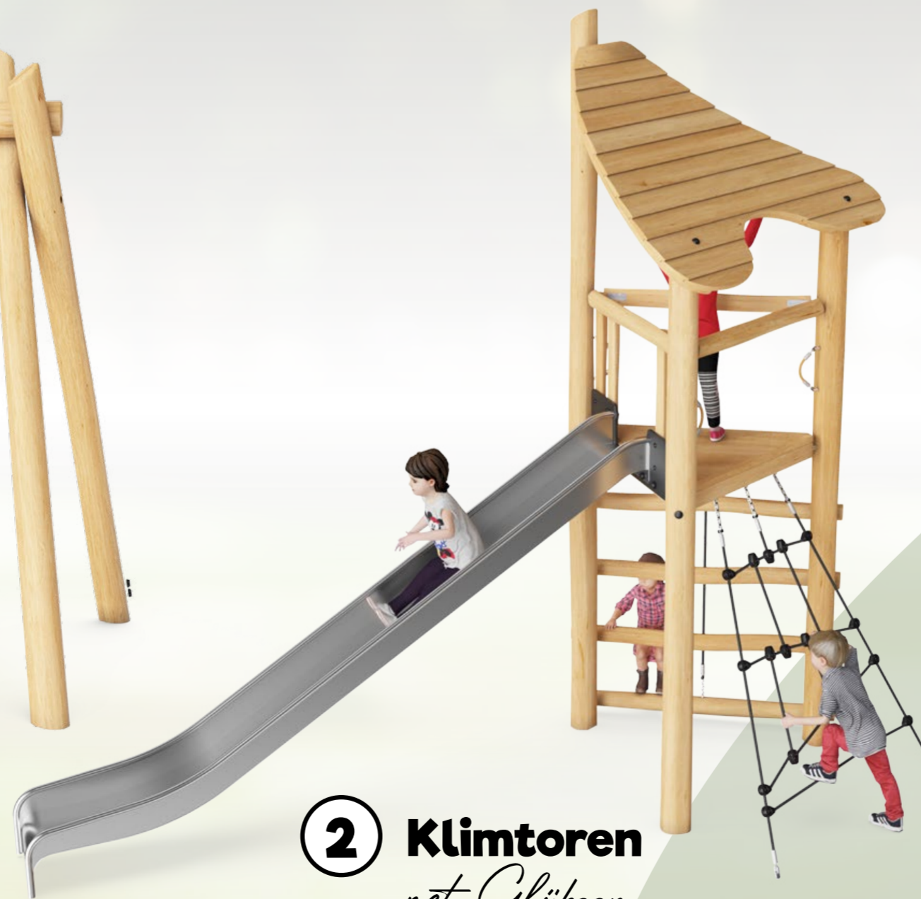
2 Klimtoren met Glijbaan