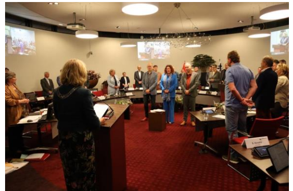
19 september 2023

De Rekenkamer heeft vervolgens ook haar Reglement van Orde, Onderzoeksprotocol en Privacyverklaring tegen het licht gehouden en aangepast aan de actualiteit. Deze documenten zijn te vinden via volgende link: Reglementen van de Rekenkamer | Gemeente Krimpenerwaard