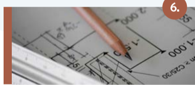
6. Wendelstraat (vroegere Michaelkerk) Project Holikiday: 23 zorgappartementen en een bedrijfsruimte voor mensen die in de zorg werken.