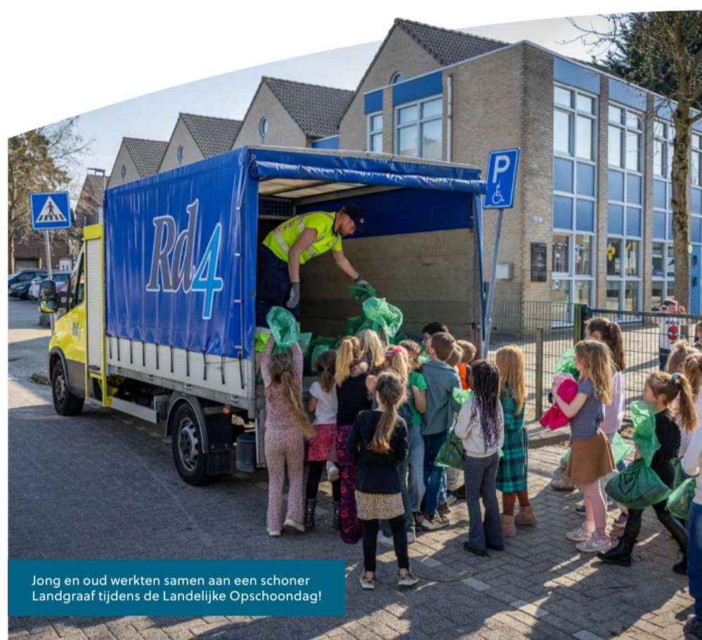
Jong en oud werkten samen aan een schoner Landgraaf tijdens de Landelijke Opschoondag!