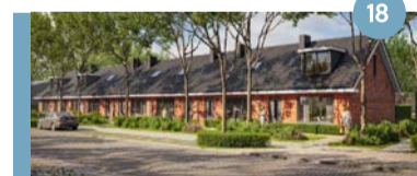
18. Hekeleweg/Steenenkruisweg In ontwikkeling zijn 28 woningen: 15 eengezinswoningen en 13 levensloopbestendige woningen (huur).