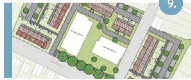
9. Wilhelmina-/Julianastraat Hier bouwen we 85 nieuwe woningen: een mix van appartementen, eengezinswoningen en levensloopbestendige woningen.