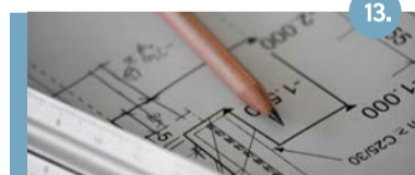
13. De Streep Project De Streep combineert nieuwbouw, transformatie en renovatie. Er komen ongeveer 70 woningen in de sociale huur, middenhuur en vrije sector.