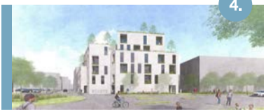
4. Markt Schaesberg In de vroegere drogisterij aan de Markt maken we 22 appartementen (huur).