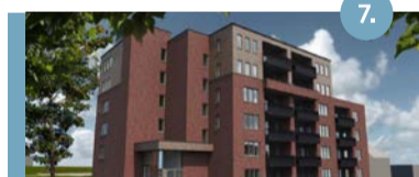
7. Hereweg Op de plek van de oude huisnummers 52 tot en met 58 komen 34 appartementen (huur).