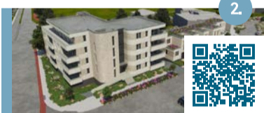
2. Muziekschool, hoek Heerlenseweg – Streepplein Nieuwbouw van 17 woningen, dit worden zowel 11 levensloopbestendige appartementen als 6 souterrainwoningen.