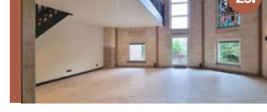
25. Reeweg - Bernadettelaan In de vroegere Bernadettekerk realiseerden we 8 woningen.