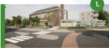
1. Stationsstraat, C'haseberg suite Mix van 17 middelgrote en grote appartementen, beganegrondwoning (9 stuks) en nultreden woningen.