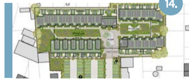
14. Stoelinga De Stoelinga-locatie wordt herontwikkeld tot een woonhof met 29 verschillende woningen (huur/ koop, ook levensloopbestendig).