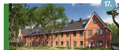
17. Nieuwenhagerheidestraat In ontwikkeling zijn 28 woningen: 15 eengezinswoningen en 13 levensloopbestendige woningen (huur).