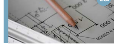
20. Hoeve Kallen: Palenbergerweg 1 Binnen de bestaande hoeve voegen we 20 appartementen (huur) toe.