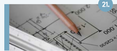
21. Locatie Transportbedrijf Janssen Deze gebieden zijn als belangrijke woningbouwlocatie in ontwikkeling.