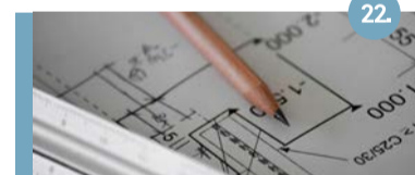
22. Licom terrein Deze gebieden zijn als belangrijke woningbouwlocatie in ontwikkeling.