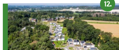
12. Bousberg 34 eengezinswoningen zijn in aanbouw.