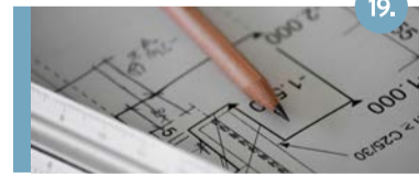
19. Vogelzankweg Dit gebied is als belangrijke woningbouwlocatie in ontwikkeling.