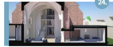
24. Theresiakerk: Salesianenstraat 118 Herbestemming kerkgebouw: 14 koopwoningen die qua prijs en grootte verschillen.