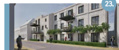
23. Hof Va Woabich, Kloosterstraat 13 appartementen (koop) worden toegevoegd. Website: 13 Woningen Hof va Woabich.