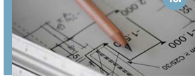
10. Hoogstraat 157-169 Langs de Hoogstraat: hier komen 25 nieuwe woningen - 22 appartementen en 3 levensloopbestendige woningen.