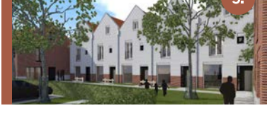
5. Wendelwiek Op de plek van de vroegere basisschool De Wendelwiek staan nu 11 nieuwe huizen voor gezinnen.