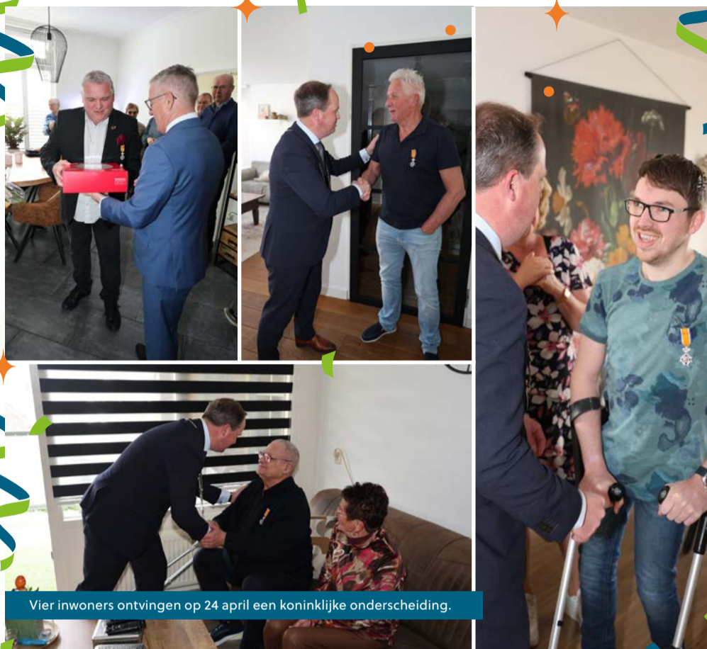
Vier inwoners ontvingen op 24 april een koninklijke onderscheiding.