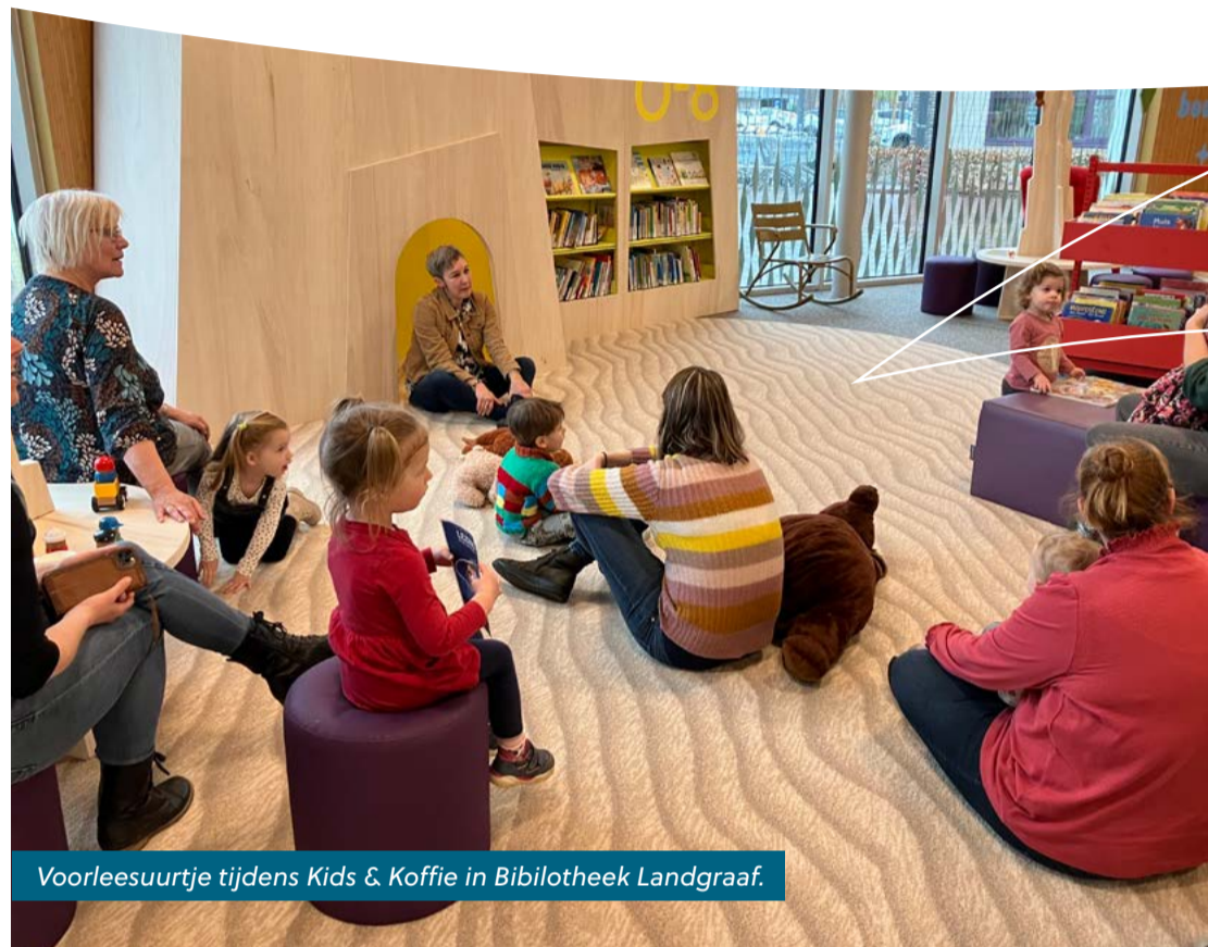
Voorleesuur tijdens Kids & Koffie in Bibliotheek Landgraaf.

een laag geboortegewicht. Of ze krijgen te maken met risico's zoals veel stress bij de ouders, sigarettenrook, slechte voeding of gebrek aan liefdevolle aandacht. Dit heeft de rest van hun leven invloed op hun lichamelijke en geestelijke gezondheid en ontwikkeling. En daarmee op de kansen op school,