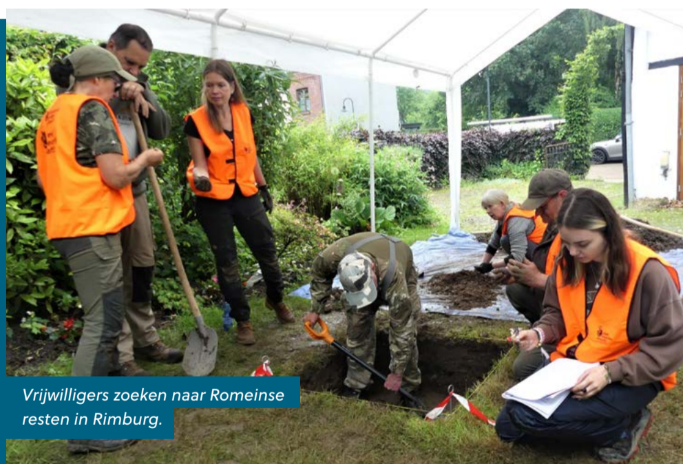
Vrijwilligers zoeken naar Romeinse resten in Rimborg.