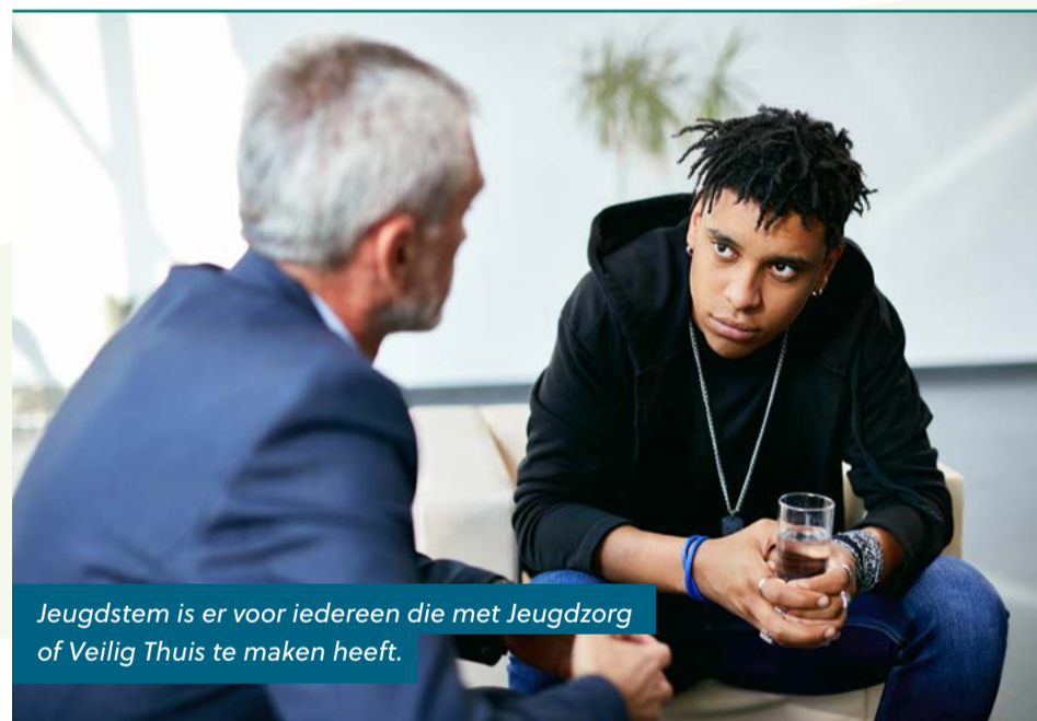
Jeugdstem is er voor iedereen die met Jeugdzorg of Veilig Thuis te maken heeft.

De chat is open van maandag tot en met donderdag van 16.00 - 20.00 uur en op vrijdag van 15.00 - 17.00 uur.