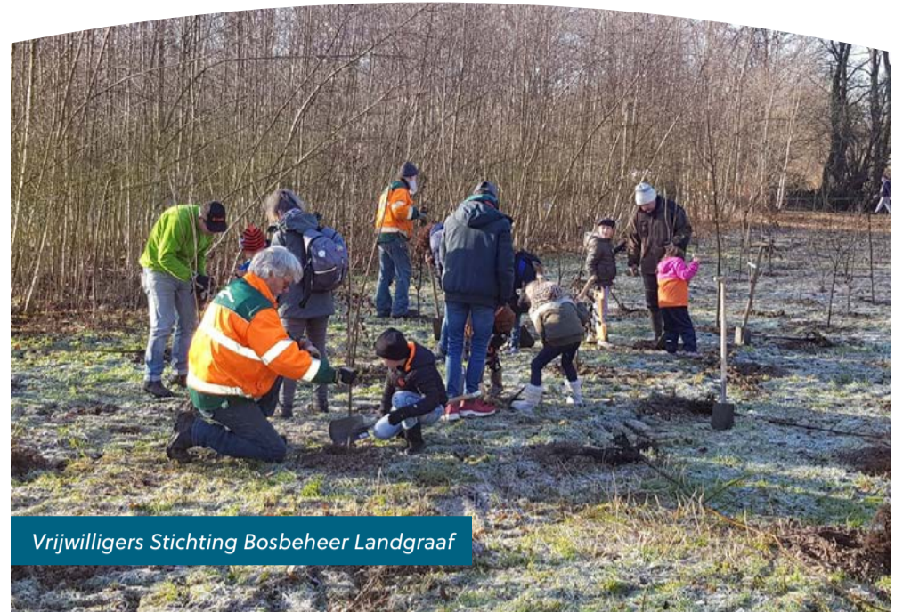
Vrijwilligers Stichting Bosbeheer Landgraaf

Dankzij de maatregelen zijn de bossen steeds beter voorbereid op een warmer klimaat. Daarnaast wordt onderzocht of we boomsoorten kunnen toepassen die beter tegen droogte en hitte kunnen. Zo blijven onze bossen ook mooi en gezond voor de volgende generaties. Samen zorgen we voor een groene toekomst in Landgraaf!