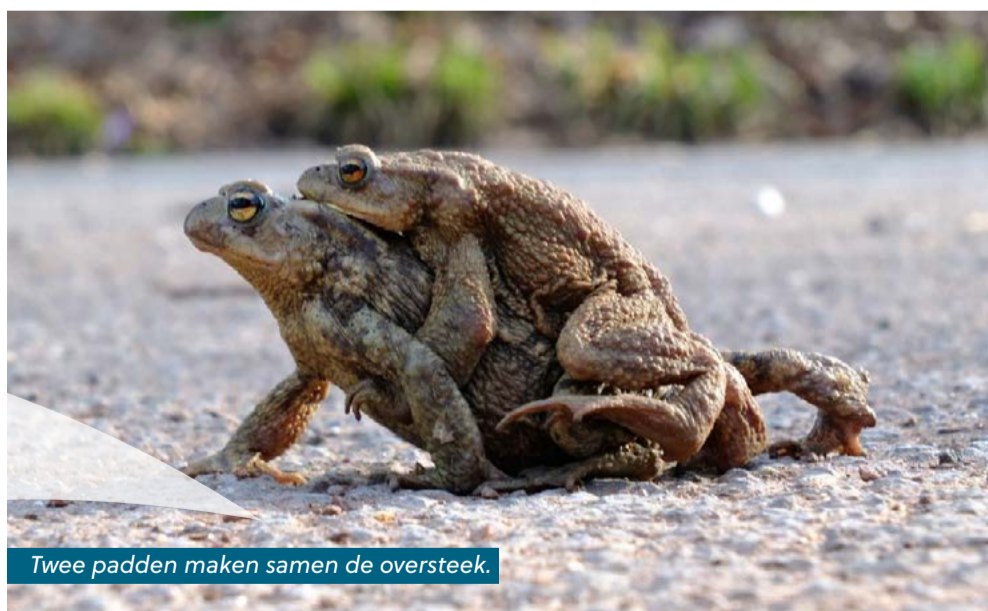
Twee padden maken samen de oversteek.

Het voorjaar komt er aan. Amfibieën worden dan wakker uit hun winterslaap en beginnen aan hun voorjaarstrek. Die reis brengt hen naar hun geboortewater. Om in meterslange snoeren of in kikkerdril eieren te leggen voor het nageslacht. Hierbij legt deze beschermde diersoort soms wel afstanden van vier kilometer af.