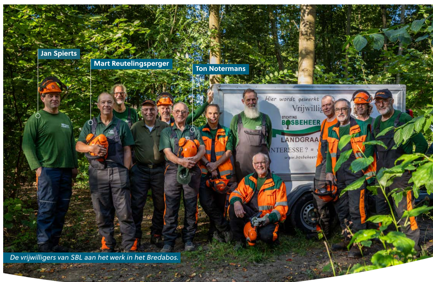
De vrijwilligers van SBL aan het werk in het Bredabos.