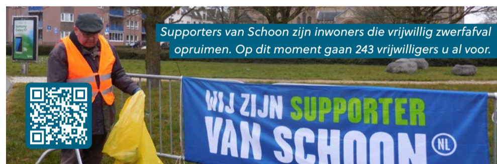
Supporters van Schoon zijn inwoners die vrijwillig zwerfafval opruimen. Op dit moment gaan 243 vrijwilligers u al voor.

Ook meedoen? Meld u aan via landgraaf.nl/zwerfafval .