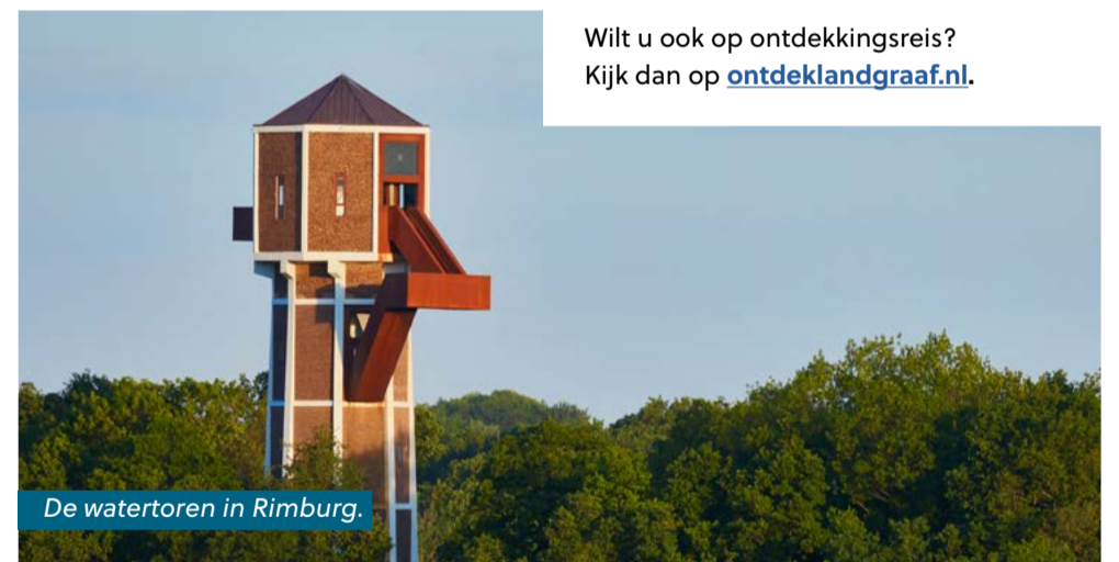
De watertoren in Rimburch.

Wilt u ook op ontdekkingsreis? Kijk dan op ontdeklanegraaf.nl .