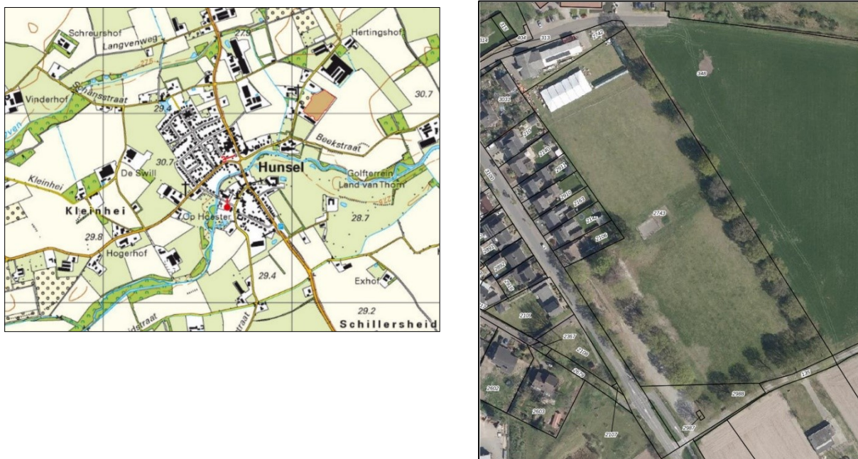
Figuur 1.1. Topografische kaart met globale aanduiding ligging onderzoeksgebied (rode lijn) en luchtfoto met aanduiding ligging onderzoeksgebied.

Het plangebied beslaat de percelen, kadastraal bekend gemeente Leudal, sectie B, nrs. 2743 en 2988, gelegen aan de Kallestraat te Hunsel.