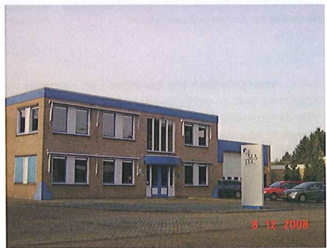
Vlaggenmasten en reclame zuilen zijn, mits wordt voldaan aan de gestelde criteria, toegestaan op industrieterreinen