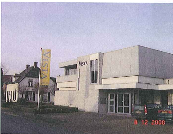
Reclame bij een bedrijf in de woonomgeving welke voldoet aan de voorschriften