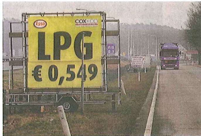
Door verwijfsreclame langs wegen ontstaat een zware aantasting van het ruimtelijke beeld