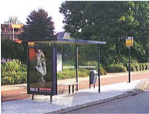
Reclame in abri's is overal toegestaan