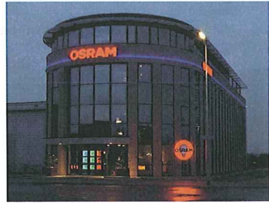
Reclames op industrieterreinen die voldoen aan de voorschriften