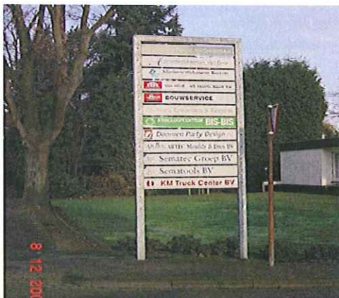
Uniforme verwijsborden aan de toegang van een industrieterrein zijn toegestaan