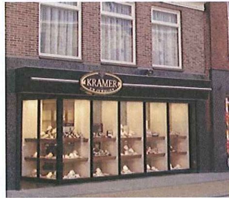
Acceptabele reclame in centrumgebied. De reclame is in evenwicht met de vormgeving van het pand