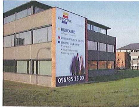
Door teveel en te grote (onsamenhangende) reclame wordt het pand zowel op zichzelf als in de (woon)omgeving aangetast