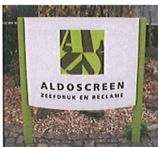
één vrijstaand reclamebord per bedrijfsbestemming in het buitengebied is toegestaan.