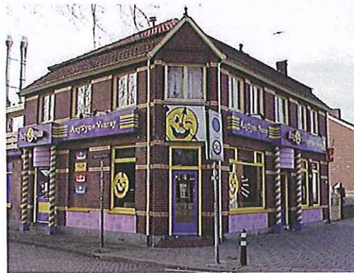
Onacceptabele reclame in het centrumgebied. De hoeveelheid, vormgeving en kleurstelling tast de vormgeving van het pand negatief aan.