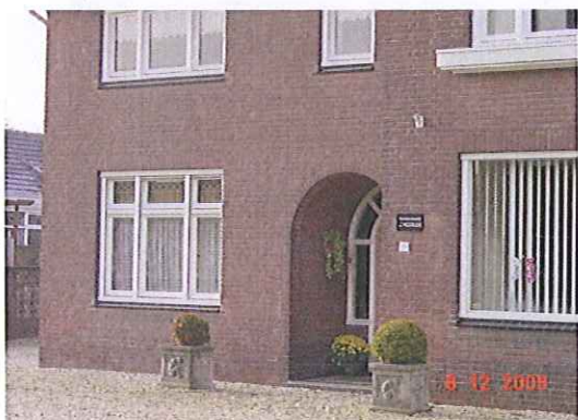
Eén klein reclamebord voor het uitoefenen van een beroep aan huis is toegestaan

Kleinschalige reclame kan worden toegestaan. Voorkomen moet worden dat het woonkarakter van het gebied van de bebouwde kom wordt aangetast door te veel aan reclame. De concrete voorschriften waaraan de reclame dient te voldoen is aangegeven in bijlage 1. Indien de reclame aan deze criteria voldoet, wordt de reclame geacht vergunningsvrij te zijn.