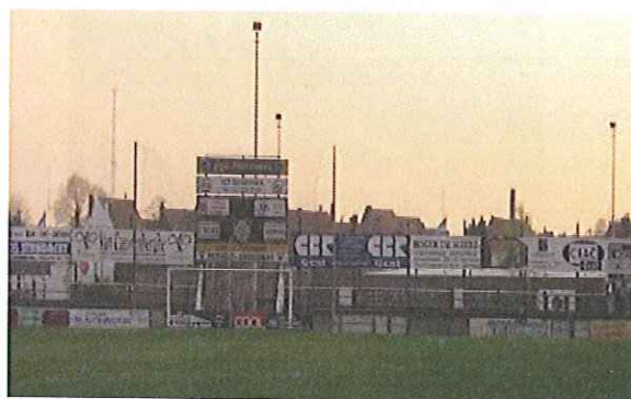
Een overdaad aan reclame is niet toegestaan