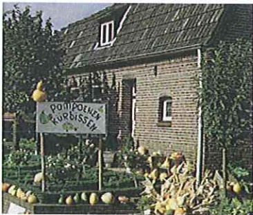
Tijdelijke reclame t.b.v. de verkoop van streekproducten is toegestaan