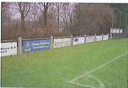
Reclame gericht naar het veld is toegestaan