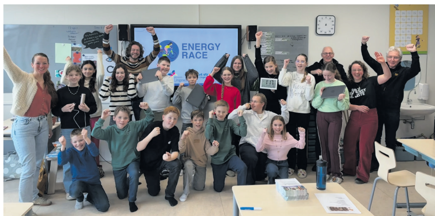
Bij IKC Pius X vond op 24 februari de officiële kick-off van de Energy Race plaats.