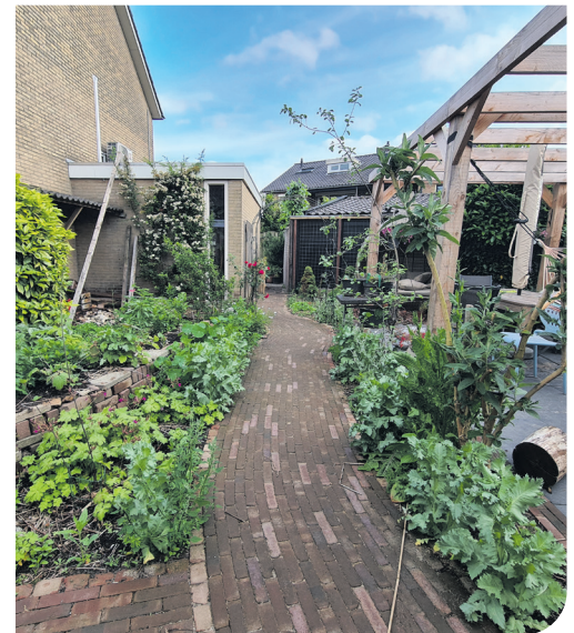
...Na de vergroening.

De bovenstaande foto's komen van een inwoner van onze gemeente. Vorig jaar haalde de Tegeltaxi haar tegels op. Deze zomer kan ze van een groene, natuurlijke achtertuin genieten.