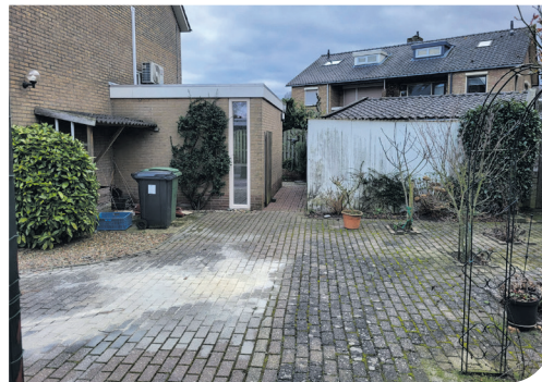
Voor de vergroening...