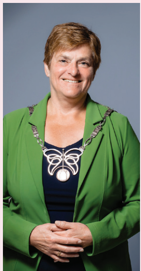
Nelly Kalfs Burgemeester

Elkaar ontmoeten blijft ontzettend belangrijk. Laten we dat met elkaar niet vergeten. En laten we ook in een periode van feest elkaar betrekken en naar elkaar om blijven kijken.