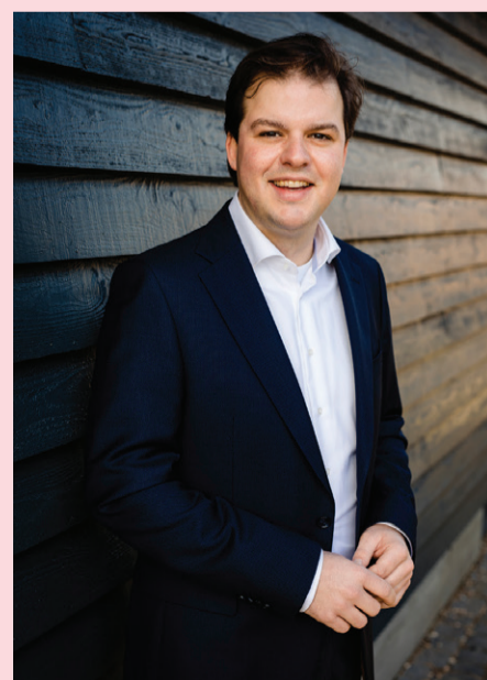
Nick Hubers wethouder financiën

Op deze pagina's geven we u een beeld van wat we vorig jaar hebben gedaan. Op lingewaard.pcportal.nl vindt u een compleet overzicht van ons jaarverslag met de details en toelichtingen.