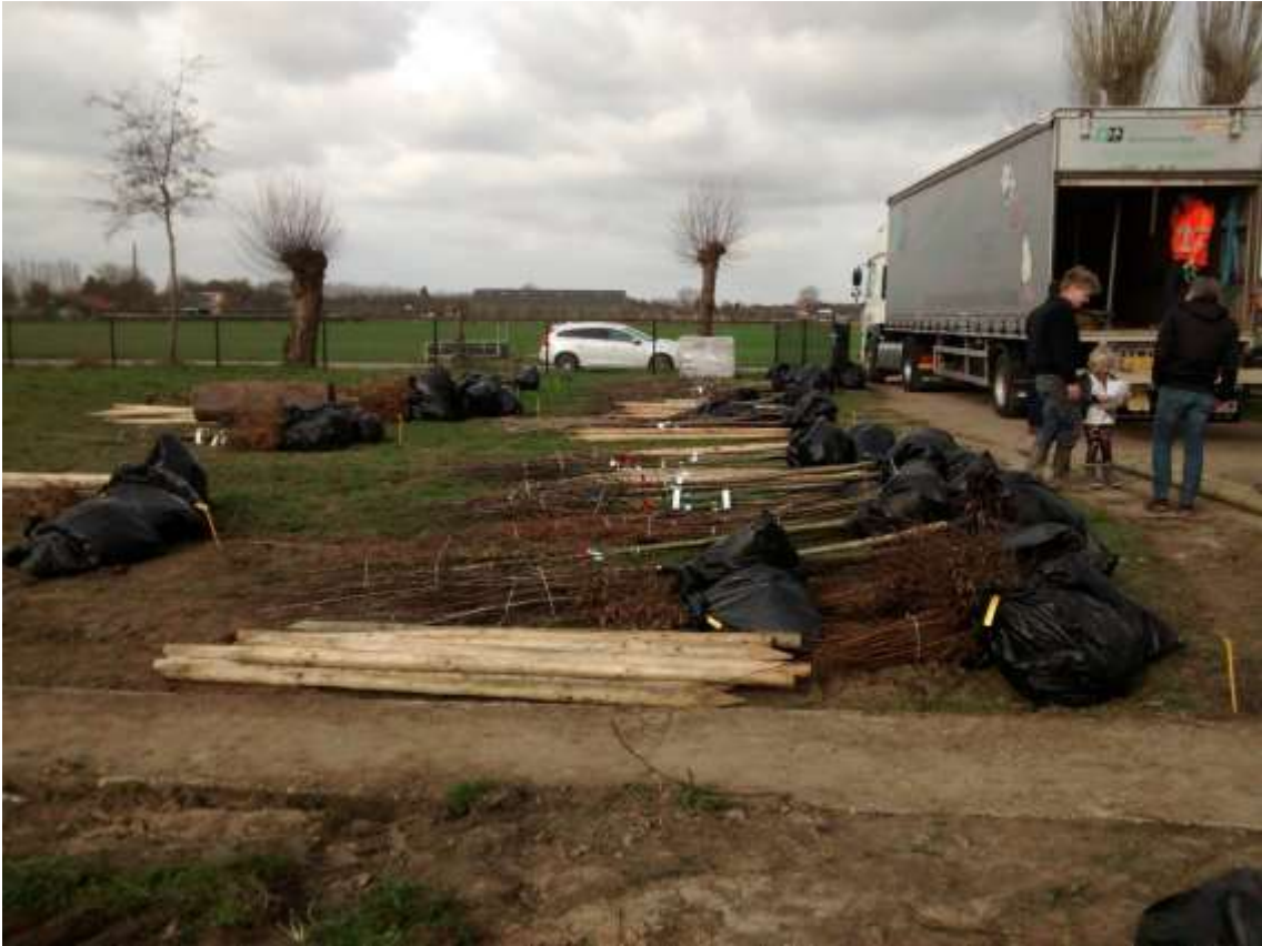
Uitdeeldag van beplanting voor verbetering van landschappelijke inpassing van erven in het buitengebied